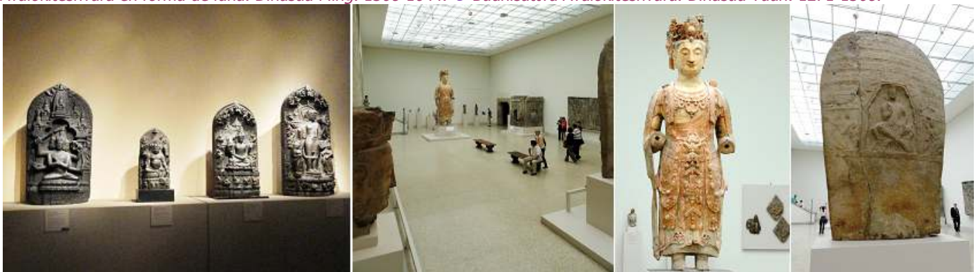
❶ Pequeños altares. ❷ Última sala. ❸ ¿?. ❹ Buda.