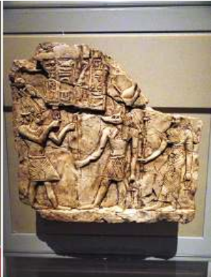
4 Estela con un rey Ofrenda a Anubis y una diosa.