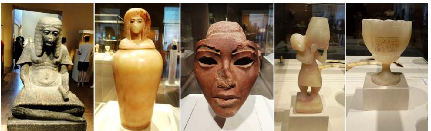
❶ Haremhab como escriba del rey. ❷ Jarrón Canopic. ❸ Cara de una estatua Comenier. ❹ Envase de cosmética en la forma de un enano. ❺ Cáliz y el florero ungüento.

Finalizamos la visita de esta sala con las últimas fotografías antes de entrar en la sala siguiente que contiene el templo de Dendur. Este templo fue construido por el gobernador romano, Petronio en Egipto en el año 15 a.C. por el encargo del emperador