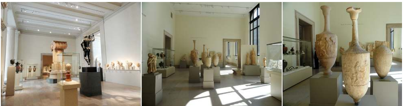
❶ Sala con alguna pieza del templo de Artemisa. ❷ Sala con objetos funerarios. ❸ Varias ánforas decoradas.