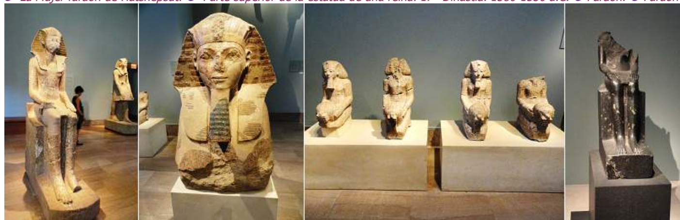
❶ Estatua reconstruida. ❷ Tres cabezas de estatuas Osiride, colocados originalmente en los nichos de la corte superior. 16ª Dinastía. Reinado de Hatsepsut y Tutmose III. 1473-1458 a.C. ❸ La cabeza y los hombros de una esfinge de Hatshepsut. 18ª