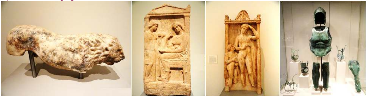
1 Fragmento de un león de mármol. 2 Mármol estela (lápida) de Phainippe. 400-390 a.C. 3 Mármol estela (lápida) de Sostratos 375-350 a.C. 4 Vitrina con diferentes objetos de bronce.