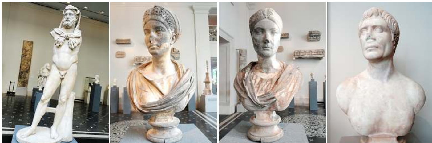
❶ Estatua de mármol de un Hércules barbudo. 68-98 d.C. Periodo Flaviano. ❷ Mármol retrato del busto, probablemente de Matidia el más joven, hermana de la emperatriz Sabina. 122-128 d.C. Periodo Andriano. ❸ Mármol retrato del busto de la emperatriz Sabina. 122-128 d.C. ❹ Mármol retrato del busto de un hombre. 110-120 d.C. periodo Trajano.