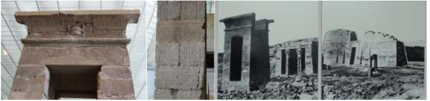
❶ Parte superior de la Pilon. ❷ Todos sus muros conservan las decoraciones grabadas. ❸ Imagen retrospectiva del templo. ❹ Otra de su parte lateral.

El tema decorativo del templo es la representación del rey Augusto, ante varios dioses.