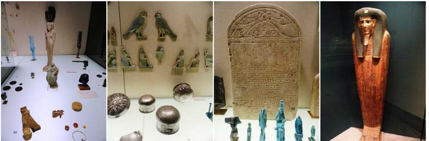
1 Objetos posibles de Cleopatra, monedas de Ptolemy III, etc. 2 Más objetos decorativos. 3 Estela y un grupo de estatuillas. 4 Isis y Neftis.