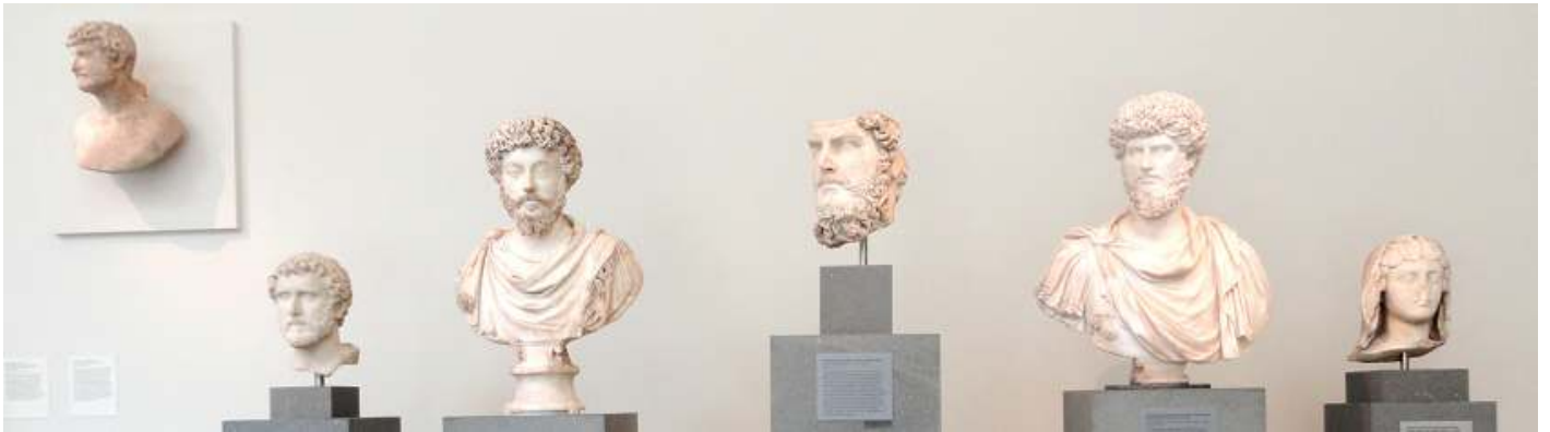
❶ Grupo de cabezas.