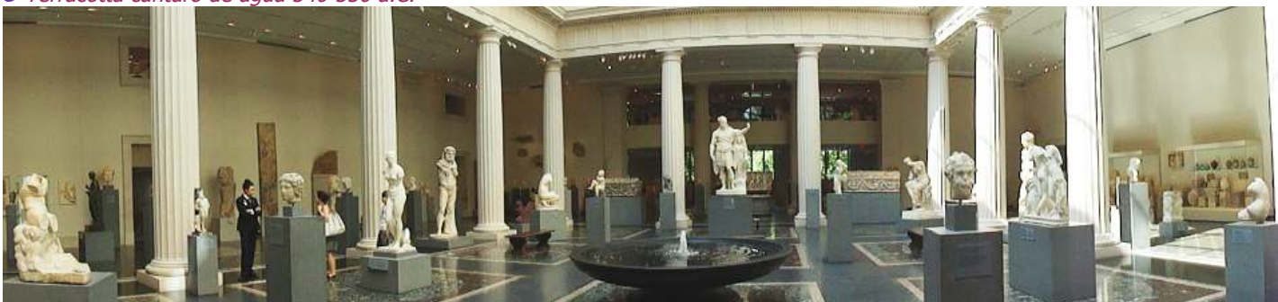
❶ Panorámica, de una nueva sala de arte griego – romano.