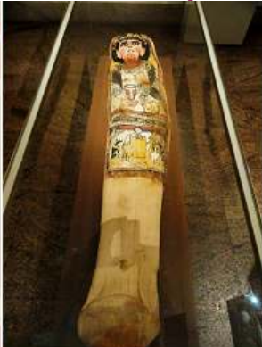
2 Una mujer mama sosteniendo un Globo y Bouquet. 270-280 d.C. del templo Mentuhotep de Tebas.