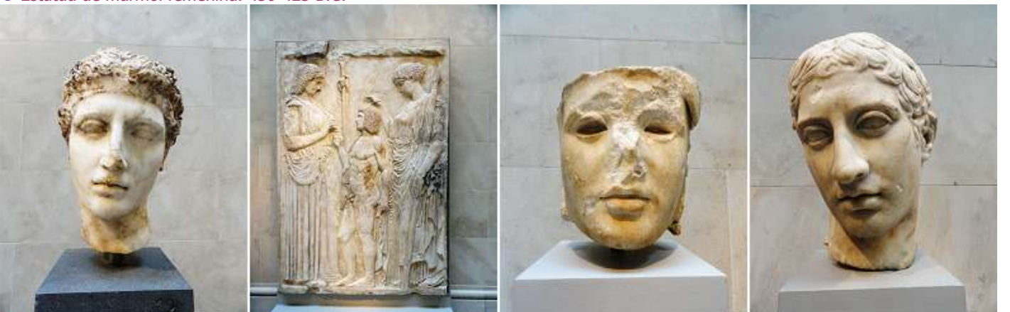
1 Cabeza de mármol de un atleta. 2 Diez fragmentos de mármol de la Gran Euleusian Relieve.27 B.C.-14 A.D. 3 Cabeza de mármol de Athena: El llamado Athena Medici . 4 Cabeza de mármol de un joven. 41-54 d. C.