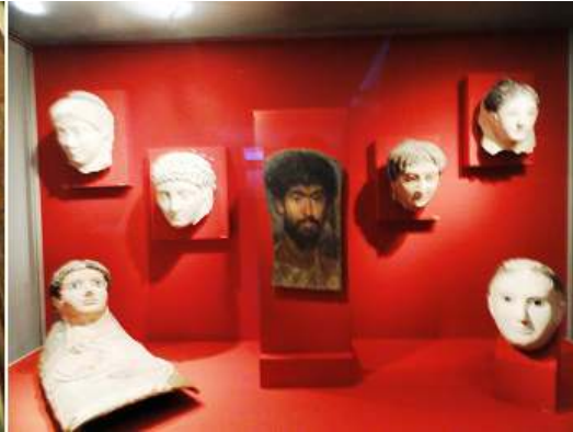
3 Vitrina con diferentes caras humanas y entre ellas un porta retrato.