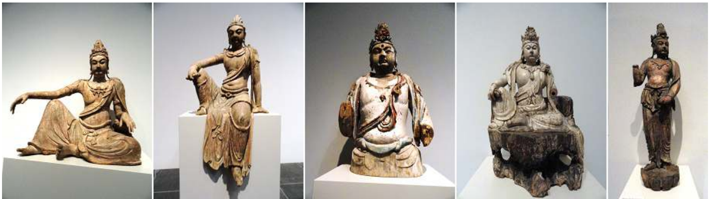
❶ Ater luna. Dinastía Liao. 907-1125. ❷ Bodhisattva Manjushri. Dinastía Song. 960-1127. ❸ Asistente Bodhisattva. ❹ Bodhisattva Avalokiteshvara en forma de luna. Dinastía Ming. 1368-1644. ❺ Budhisattva Avalokiteshvara. Dinastía Yuan. 1271-1368.

La dinastía Song que gobernó durante los años 960 y 1279, fue el primer gobierno que uso el papel moneda, el conocimiento del uso de la pólvora y la ubicación del norte verdadero usando la brújula. Le sucedió la dinastía Yuan.