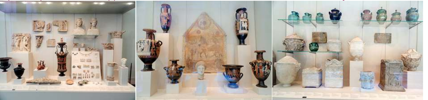
1 - 2 - 3 Vitrinas con diferentes objetos decorativos.