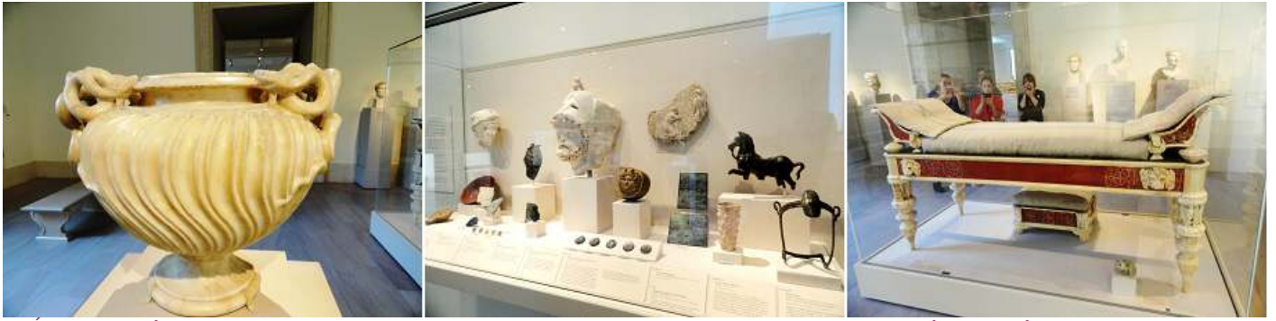
❶ Ánfora de mármol con asas de serpientes. Periodo Antonino. ❷ Vitrina con piezas de decoración. ❸ Diván