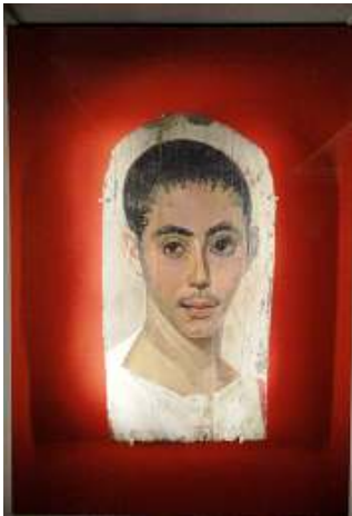
1 Joven con incisión quirúrgica en el ojo derecho. 190-210 D.C.