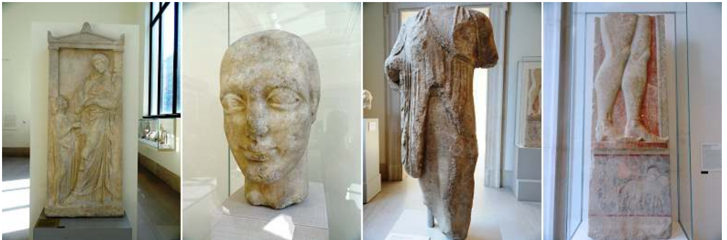
1 Estela de mármol. 400-390 B.C. 2 Cabeza. 490 B.C. 3 Estatua femenina de Paros. 4 Fragmento de mármol. 525-515 B.C.