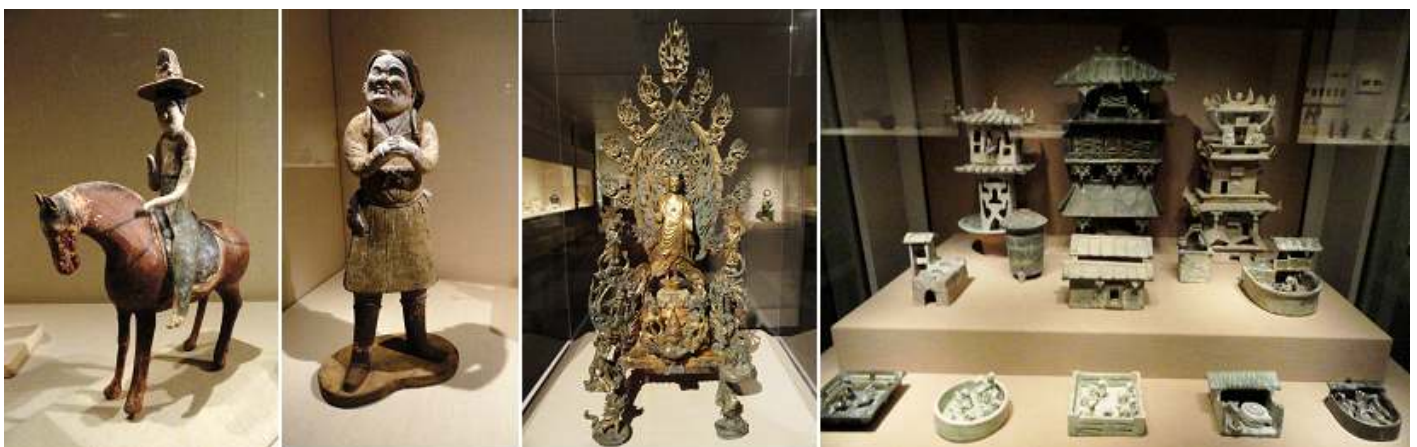
1 Horse and female rider. Dinastía Tang. 2 Standing attendant. Dinastía Tang. 3 Buda Maitreya. Dinastía Wei. Bronce. 4 Objetos decorativos del hogar, de la dinastía Han.

La dinastía Tang, sucesora de la dinastía Sui, gobernó el periodo de tiempo del 618 hasta el 907, e interrumpida por la segunda dinastía Zhuo el periodo de 690 al 907.