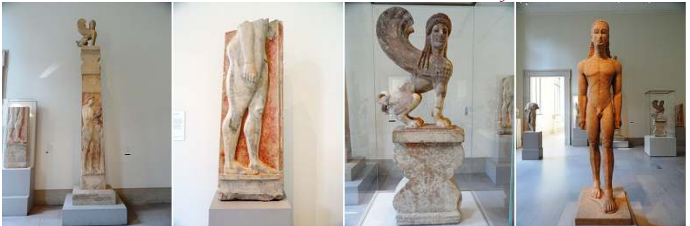
1 Estela de mármol. 530 B.C. 2 Fragmento de mármol de una estela. 530 B.C. 3 Capitel de mármol y remate en forma de una esfinge. 530-B.C. 4 Estatua de mármol de kouros. 590-580 B.C.