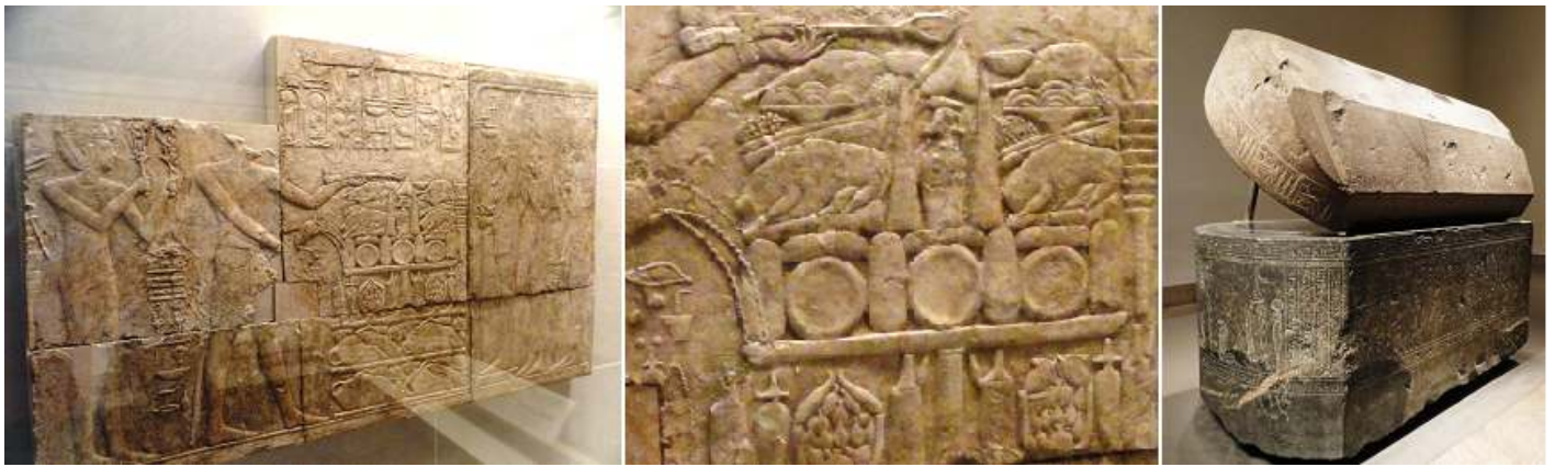
1 Sala. 19ª Dinastía. Reinado de Seti I 1291-1279 a.C. 2 Detalle central del muro donde aparecen alientos y utensilios ¿ofrendas?. 3 Colosal sarcófago de granito.

Finalizamos con las salas de Arte Egipcio, y comenzamos con las salas orientales... China El reinado de Wei fundado por Cao Pi y su padre Cao Cao, esta dinastía gobernó desde el 184 al 283 d.C.