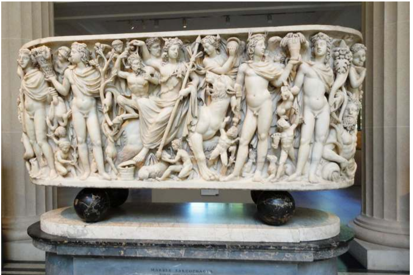
❶ Mármol sarcófago 220-230 DC Dionisos con sus asistentes y las cuatro estaciones.