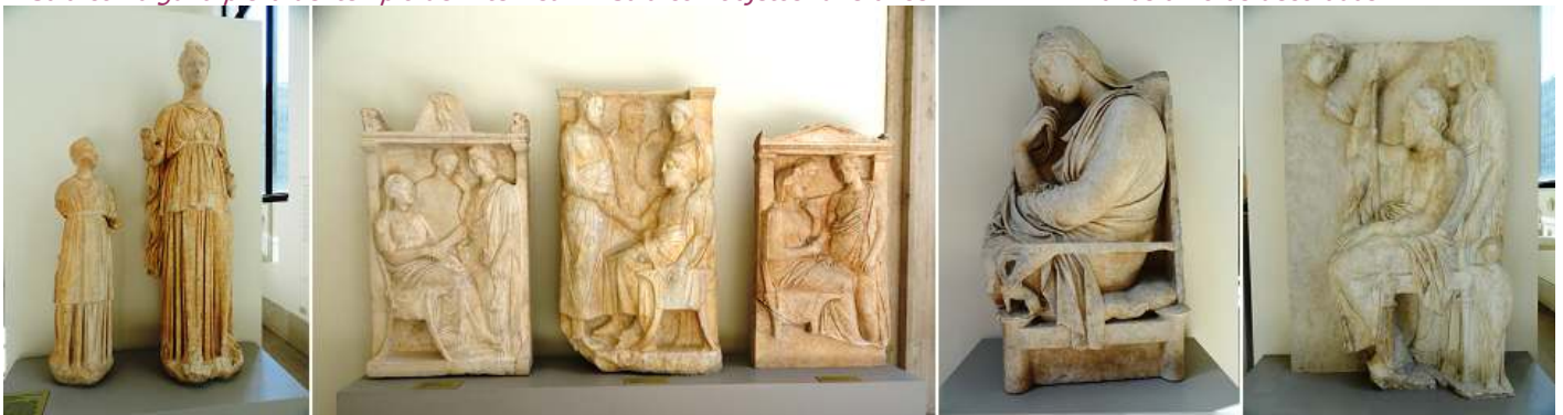
❶ Estatuas funerarias 320 a.C. ❷ Estelas de mármol. 375-350B.C. ❸ Estela de mármol con una mujer. ❹ Conjunto familiar de mármol 350 B.C.