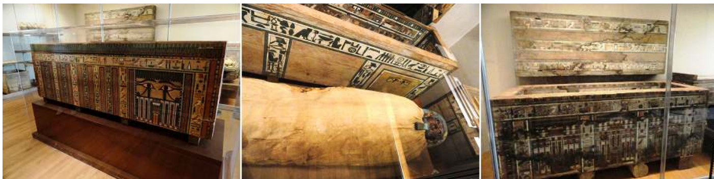
❶ - ❷ - ❸ Sarcófagos de madera decorada exterior e interiormente.