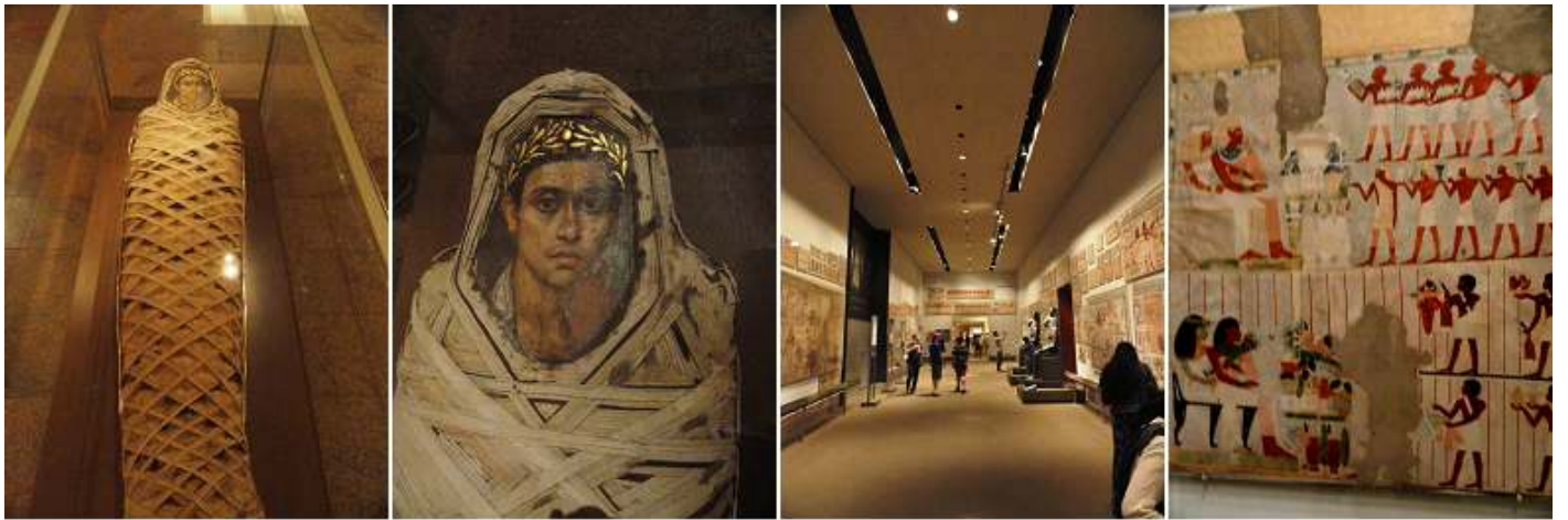
1 Momia con un panel retrato insertado de un joven . 80-100 d.C. 2 Detalle de la pintura de la anterior momia. 3 Sala con pinturas murales. 4 Una muestra de las pinturas murales.