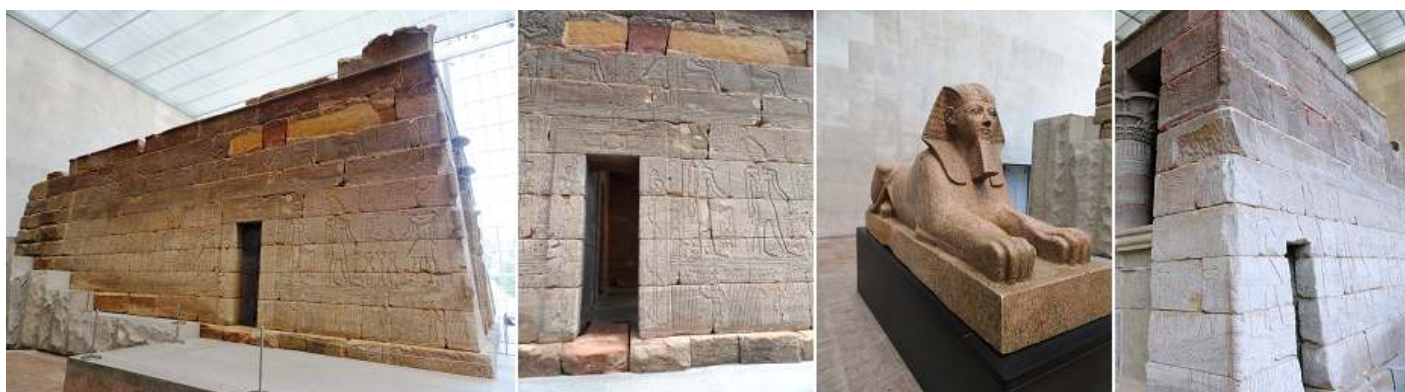
❶ Lateral izquierdo. ❷ Detalle de su puerta de este lateral. ❸ Escultura. ❹ Lateral exterior derecho.

En su reinstalación en el museo, se persiguió la representación del lugar de su ubicación ante el Nilo, y el muro de rocas en su parte trasera y la gran explanada para el culto.