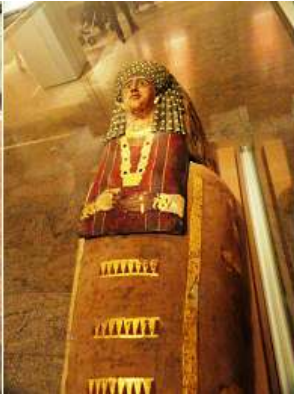
2 Otra imagen de la misma momia . Artemidora. 90-100 d.C.