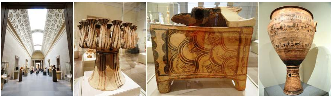
❶ Pasillo central del sector del Arte Griego. ❷ Candelabro terracota múltiple. 2300-2200 B.C ❸ Terracota larnax. ❹ Ánfora de terracota decorada con carros, caballos y guerreros. 750 B.C.