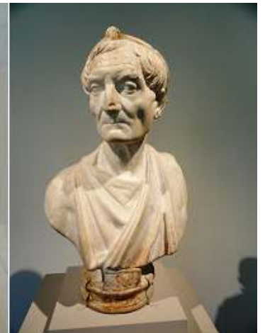
❶ Mármol, retrato del busto de Alejandro Severo. ❷ Auto retrato del emperador Caracalla 212-217 d.C. ❸ Fragmento bronce autorretrato del emperador Caracalla 212-217 d.C. ❹ Busto de mármol de un sacerdote. 117-138 d.C.