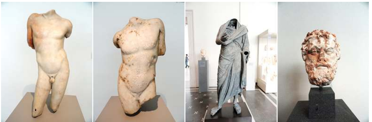
1 Torso de mármol de un muchacho. Periodo imperial. 2 Otro torso de mármol de un muchacho. Periodo imperial. 3 Estatua de bronce de hombre. Periodo helenístico. 4 Cabeza de mármol de un hombre barbudo. Periodo imperial.