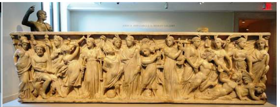
❷ Sarcófago de mármol con la representación entre las musas y las sirenas.