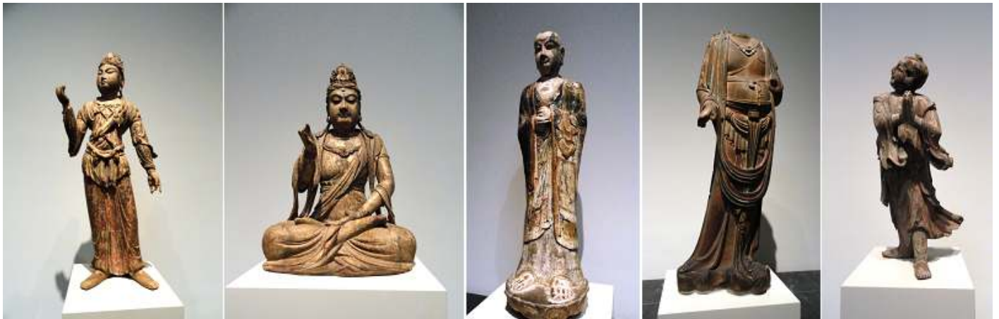
❶ Bodhisattva asistente . Dinastía Song. 960-1127. ❷ Bodhisattva Avalokiteshvara. Dinastía Song. 960-1127. ❸ Monk, probable Ananda. Dinastía Tang. 618-907. ❹ Bodhisattva. Dinastía Jin. 1115-1234. ❺ Pilgrim Sudhana. Dinastía Ming. 1368-1644.

La dinastía Song que gobernó durante los años 960 y 1279, fue el primer gobierno que uso el papel moneda, el conocimiento del uso de la pólvora y la ubicación del norte verdadero usando la brújula. Le sucedió la dinastía Yuan.