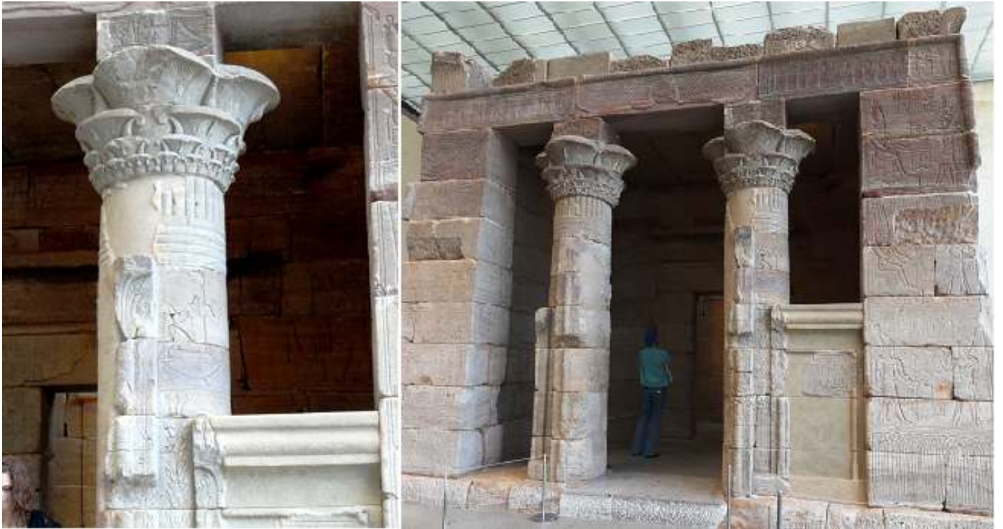
❶ Una de las dos columnas del pórtico de sus entrada. ❷ Fachada del templo de Dendur. En sus paredes exteriores esta el emperador Augusto también representado como un faraón.