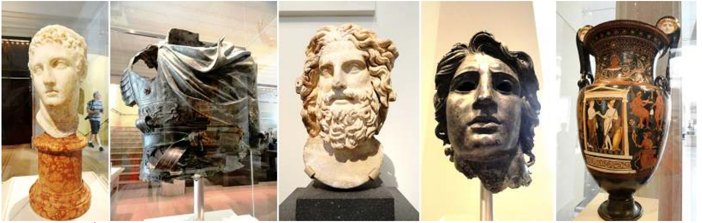
❶ Cabeza de mármol de un joven llevando una diadema con cuernos. ❷ Torso de bronce de una estatua ecuestre. ❸ Cabeza de mármol de Zeus Amón. 120-160 d.C. ❹ Retrato de bronce de Alejandro Magno. 150 a.C. – 138 d.C. ❺ Terracota voluta crátera. 340-320 a.C.