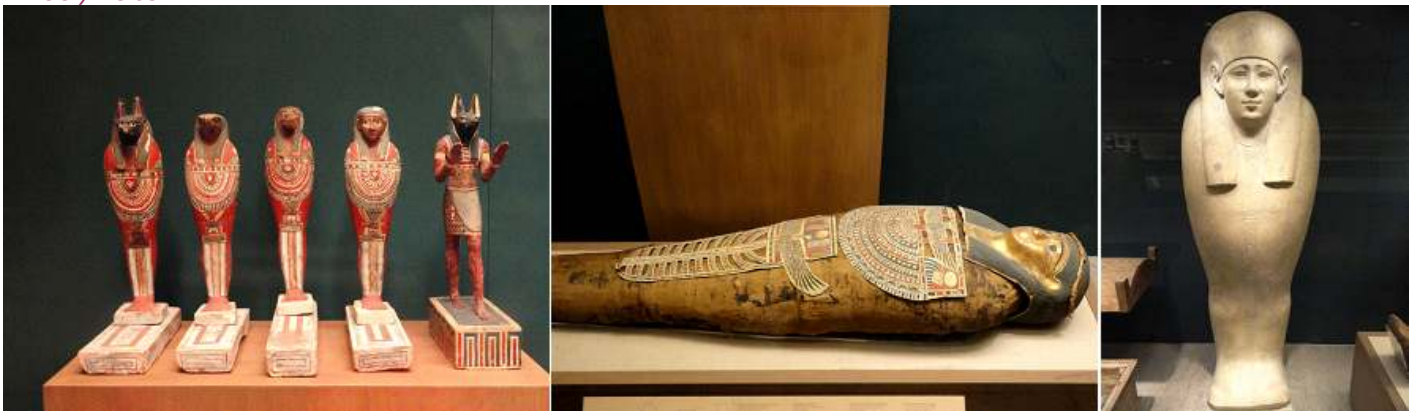
1 Estatuillas de barro cocido decorado, con las divinidades. 2 El ataúd y la momia de Esmín, periodo Ptolemaico. 305-30 a.C. 3 Sarcófago de Djehor, periodo Ptolemaico. 200-150 a.C.