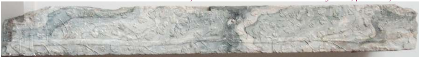
❶ Pilastra de mármol, con decoración vegetal. 117-138. Periodo Adrianico.