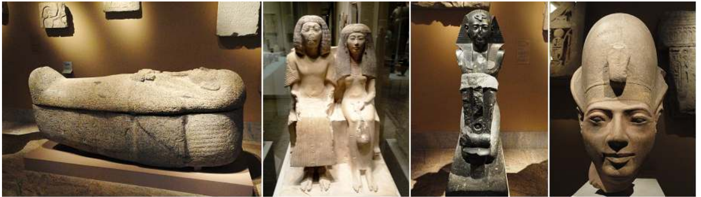
1 Sarcófago de granito. 2 Pareja de ¿? 3 Estatua de Seti I. 19ª Dinastía. 1294-1279 a.C.. 4 Jefe del rey Amenemhat. 19ª Dinastía. 1207-1200 a.C. del templo de Karmak.

Esta instalado en el ala Sackler desde 1978 que se trajo de Egipto.