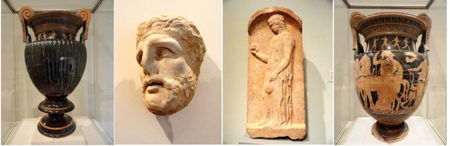
1 Terracota voluta crátera (recipiente para el vino de mezcla y con soporte) 430 B.C. 2 Cabeza de mármol de un hombre con barba de estela (mercado grabe)350-325 B.C. 3 Mármol estela (lápida) de una joven . 440-425 B.C. 4 Terracota, ánfora.