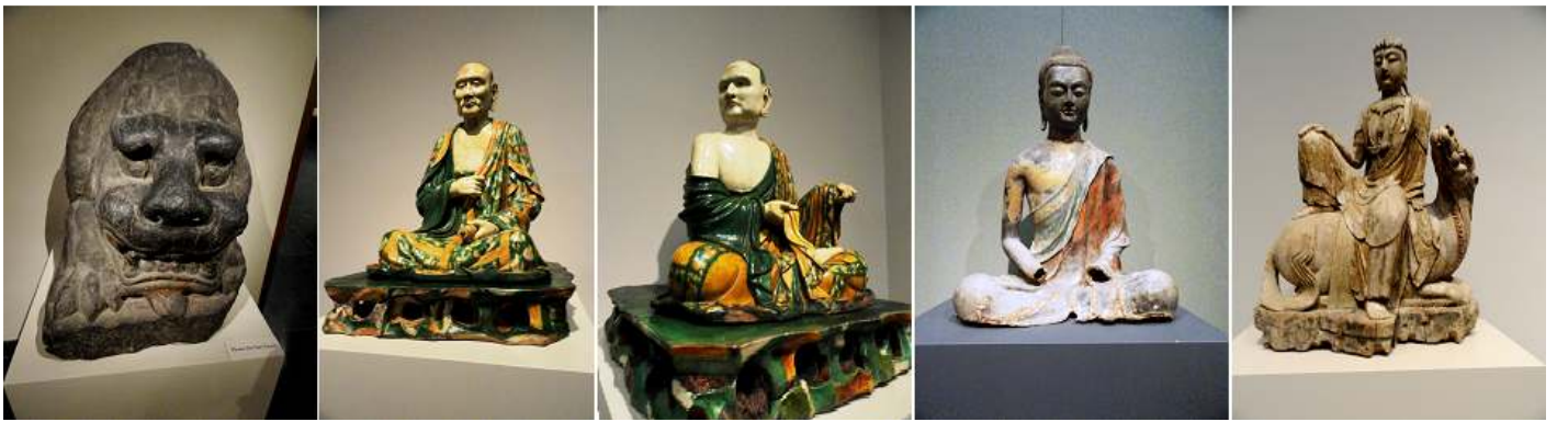
❶ León Guardián. Dinastías Six. ❷ Arhat. Dinastía Liao. 907-1125. ❸ Arhat. Dinastía Liao. 907-1125. ❹ Buda, probable Amitabha. Dinastía Tang. 618-907. ❺ Bodhisattva Avalokiteshvara de los Leones o Simhanada Avalokiteshvara . Dinastía Ming. 1368-1644.