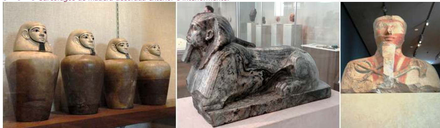
❶ Ánforas con los órganos momificados. ❷ Sphinx del rey Sesostris III. 12ª Dinastía, 1878-1840 a.C. ❸ Cabeza y hombros de una estatua de Osiride. 18ª Dinastía. Reinado de Hatsepsut y Tutmose III. 1473-1458 a.C.