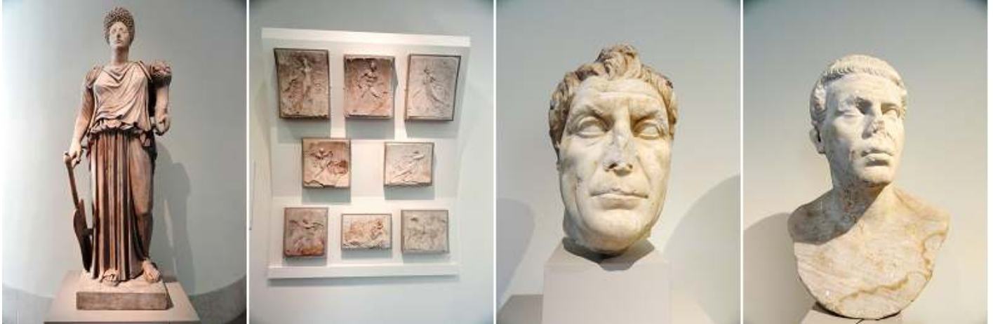
❶ Estatua de mármol de Tyche-Fortuna restaurada con la cabeza retrato de una mujer. ❷ Diferentes piezas de estuco decorativo. ❸ Autorretrato de mármol de un varón. 100 d.C. ❹ Otro auto retrato de un hombre