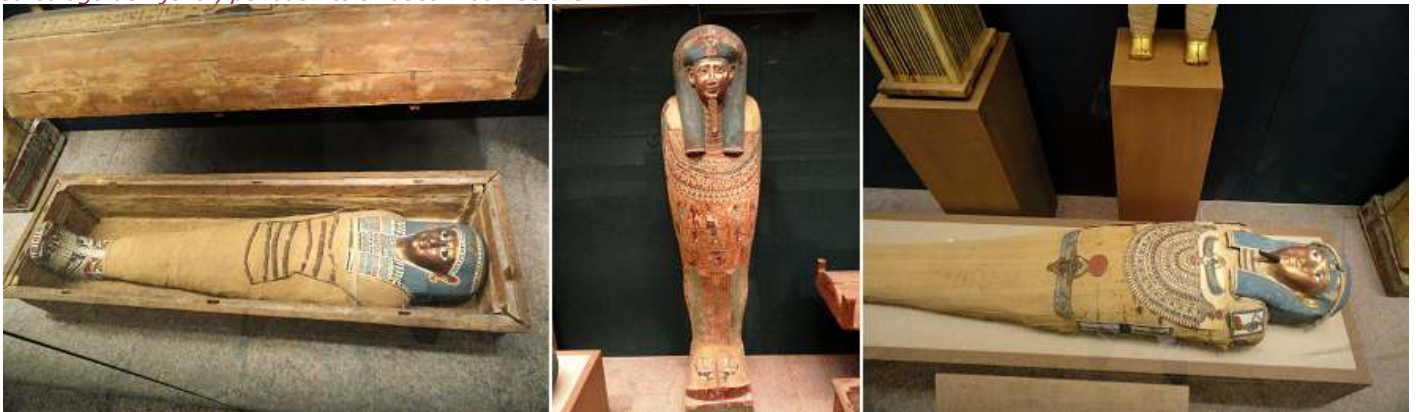
1 El ataúd y la momia de Ta-Shery-En-Iset. Periodo Ptolemaico. 305-30 a.C. 2 El ataúd y la momia de Esmín. Periodo Ptolemaico. 305-30 a.C. 3 Otra momia de la misma vitrina.