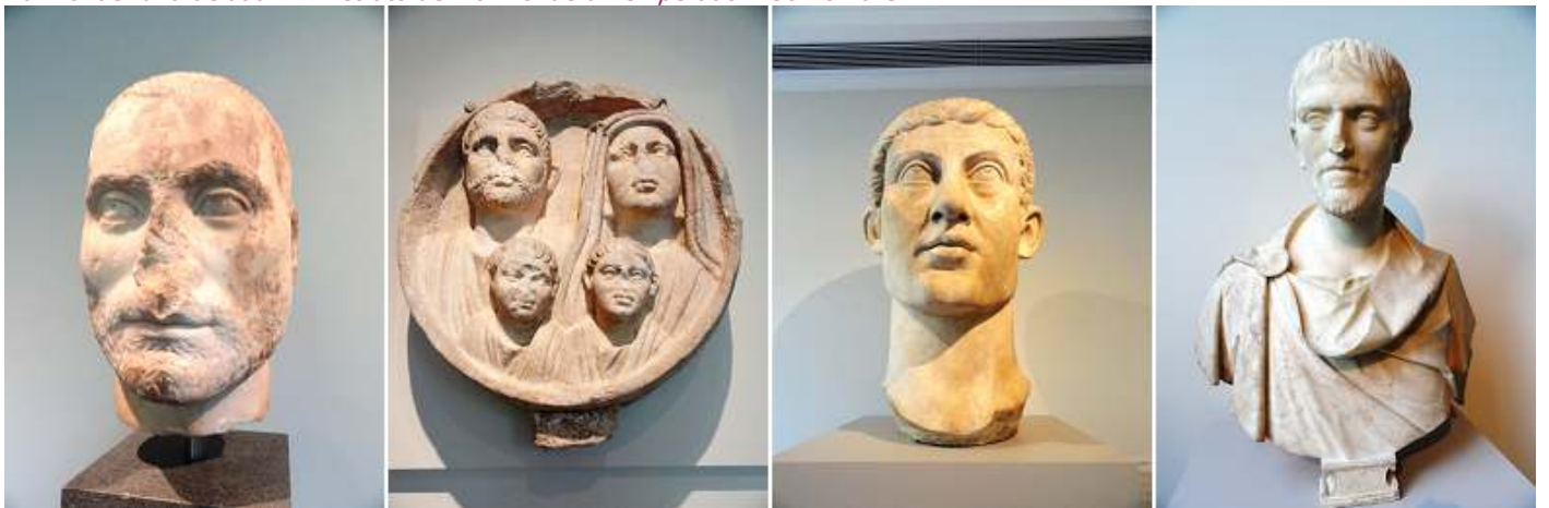
❶ Retrato de mármol de un hombre. ❷ Relieve de mármol funerario. ❸ Retrato de mármol escuchar del emperador Constantino I. 325-370 d.C. ❹ Mármol retrato del busto de un hombre.