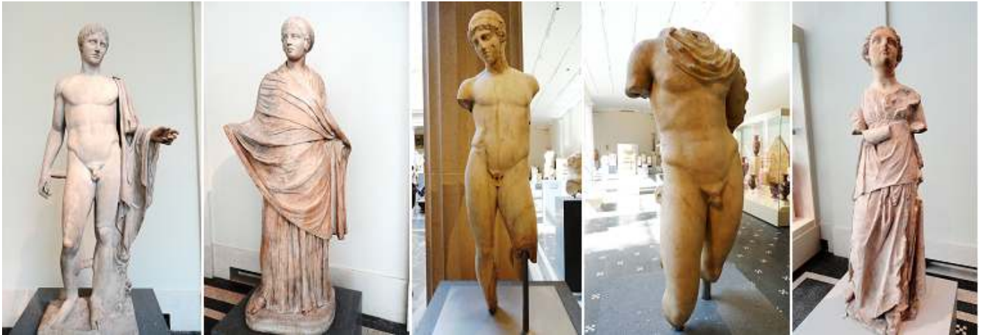
1 Estatua de mármol de Hermes. 2 Estatua de mármol de una niña del periodo romano imperial. 3 Estatua de mármol de un joven. 4 Estatua de mármol de Hermes. 5 Mármol y la estatua de piedra caliza de un asistente. Griego sur de Italia.