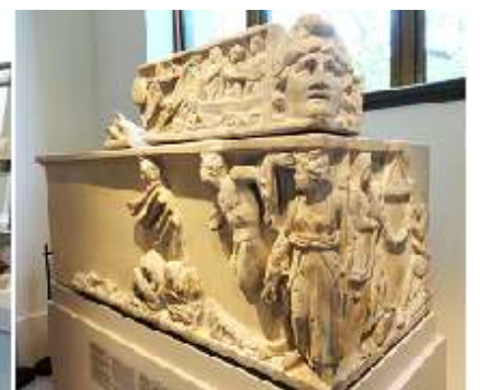
❶ Sarcófago de mármol con el mito de Endimión. ❷ Fragmentos de mármol del sarcófago con escenas de Orestia.