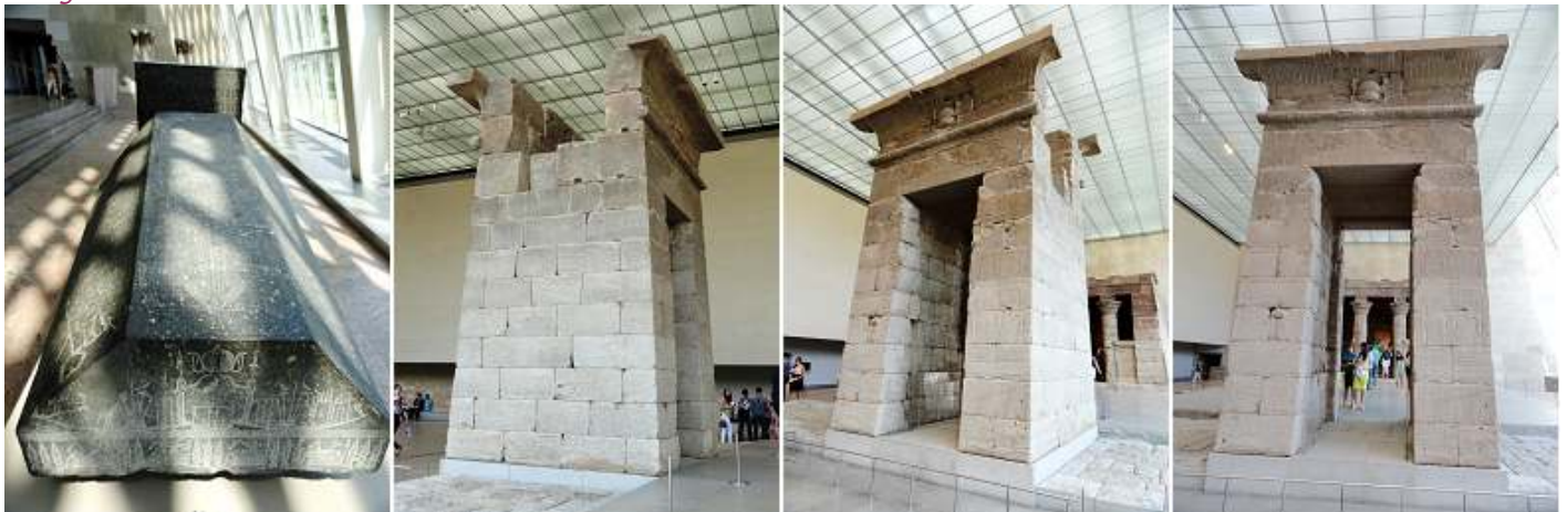
1 Sarcófago 30ª Dinastía. 2 - 3 - 4 Tres secuencias de la primera pylon del templo.