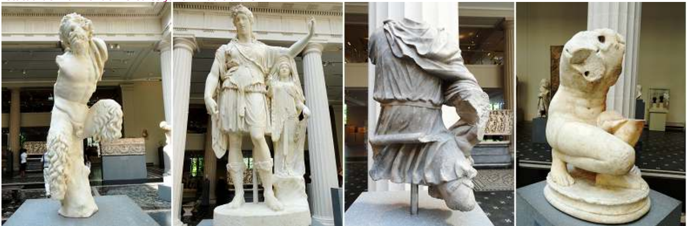
❶ Estatua de mármol de Pan. Periodo imperial. ❷ Estatua de mármol de Dionisos apoyado en una figura femenina arcaizante. 27 a.C. – 68 d.C. ❸ Limestone torso de un cazador. Periodo imperial. ❹ Estatua de mármol de Afrodita agachada, periodo imperial.