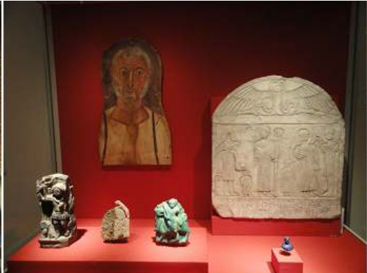
3 Otra vitrina con objetos y fragmentos de una pintura.