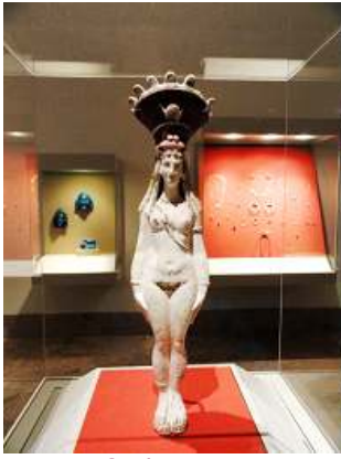
1 Isis-Afrodita. tempera.