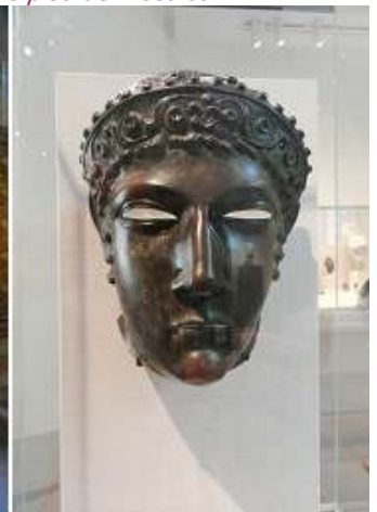
1 Inscripción de mármol. 2 Inscripción en la base de una estatua de mármol. 160-170 d.C. 3 Urna funeraria de alabastro. 4 Bronce máscara deporte caballería.