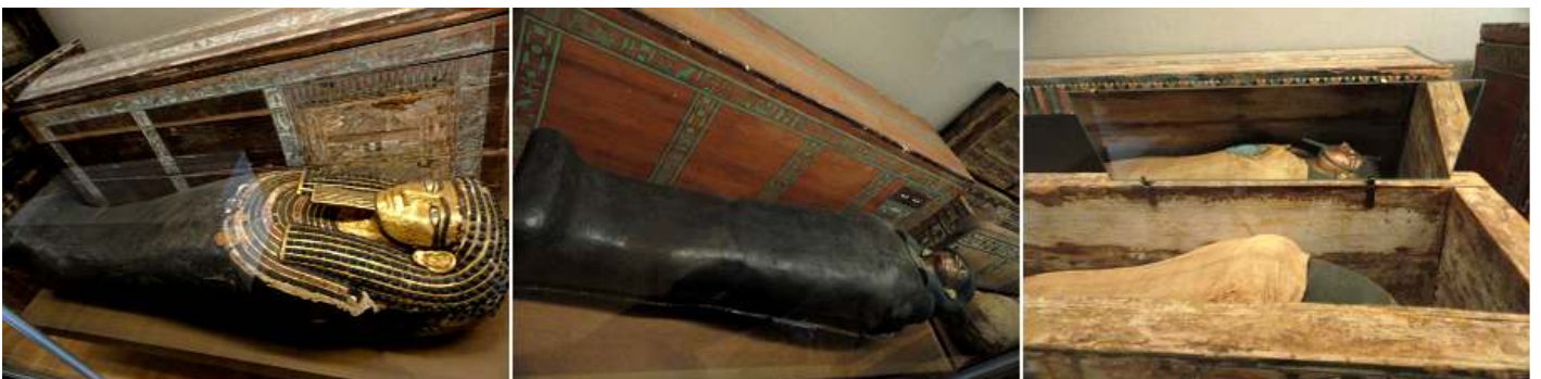
1 - 2 - 3 Diferentes tipos de cajas funerarias y momias,