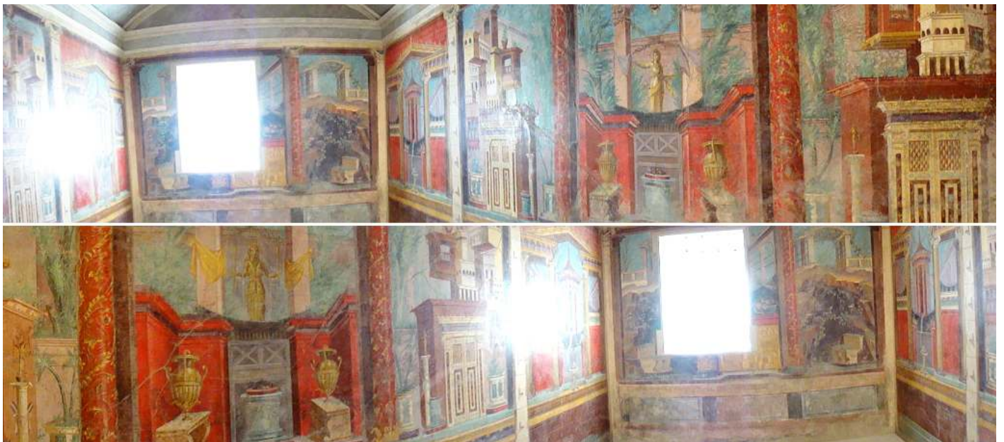
1 Diferentes lados del Hall de recepción de esta villa.

Diferentes pinturas murales de la villa de P. Fannius Synistor at Boscoreale, con numerosas habitaciones, y dos patios con un amplio pórtico.