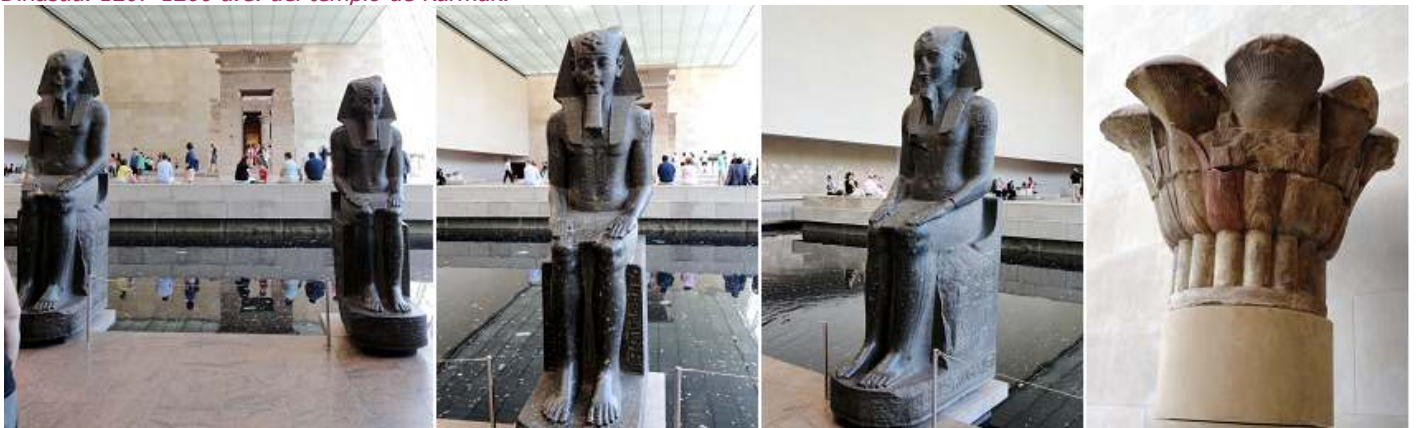
1 El templo ante una gran lámina de agua, simulando el Nilo. 2 Escultura sedente. 3 Otra. 4 Capitel papiriforme. 30ª Dinastía. 340-343 d.C.