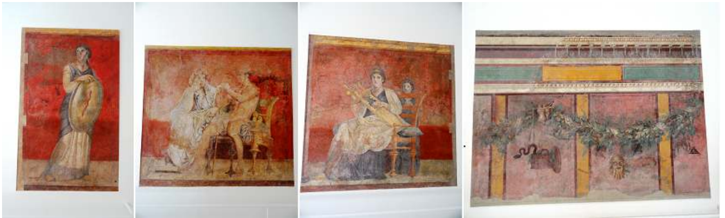
1 - 2 m- 3 Mas muestras de esta habitación que nos aportan la vida cotidiana de estas mansiones romanas 4 Muestra de una habitación contigua a la anterior.