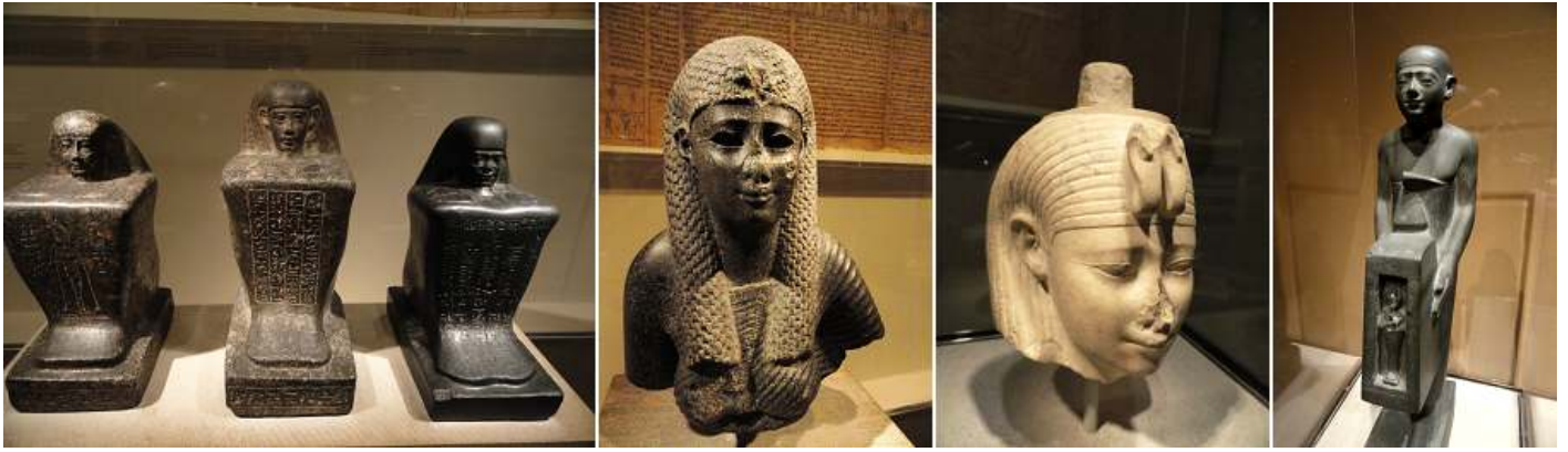
1 Tres estatuillas con diferentes inscripciones. 2 Cabeza de mujer. 3 Cabeza atribuida a Arsinoe II. Periodo Ptolemánico 278-276 a.C. 4 Hombre que sostiene un Santuario Containing una imagen de Osiris.