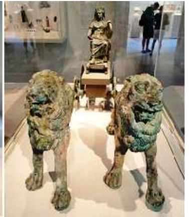
3 Otra vista de la Cibeles.