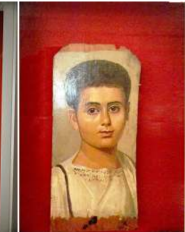
2 Retrato de los Eutiques Boy 100-150 d.C.