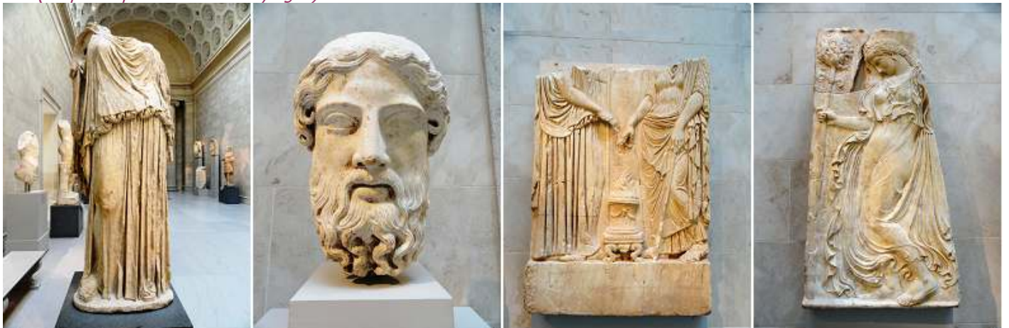
1 Estatua de mármol de Eirene (la personificación de la paz) 14-68 d.C. 2 Cabeza de mármol. 3 Parte inferior de un relieve en mármol con dos diosas. 4 Relieve de mármol con una ménade bailando. 27 a.C. - 14 d.C.