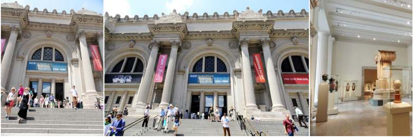
❶ Fachada del Metropolitano a la 5ª Av. ❷ Con una portada adelantada de tres arcos de medio con pares de columnas dobles entre las puertas. ❸ Primera sala del arte griego. OTRAS VISITAS PRÓXIMAS: Central Park (447 m) Museo Guggenheim (539 m) Whitney Museum of American Art (674 m) Museo de Historia Natural (936 m) The Frick Collection (976 m).