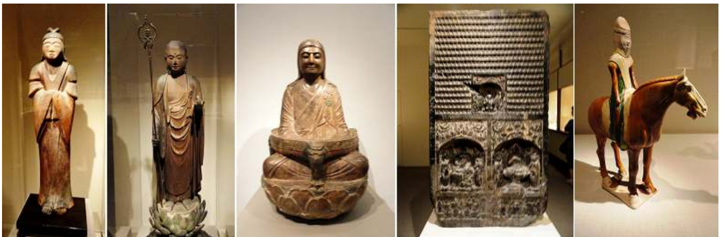
1 Mujer deidad sintoísta. Periodo Kamakura 1185-1333. 2 Intan. Jizō Bosatsu. Periodo Kamakura 1185-1333. 3 Munk Sengqie. Dinastía Song. 960-1127. 4 Estela con los Bodhisattvas. Dinastía Tang. 5 Caballo y jinete femenino. Dinastía Tang.

Finalizamos con las salas de Arte Egipcio, y comenzamos con las salas orientales... China El reinado de Wei fundado por Cao Pi y su padre Cao Cao, esta dinastía gobernó desde el 184 al 283 d.C.