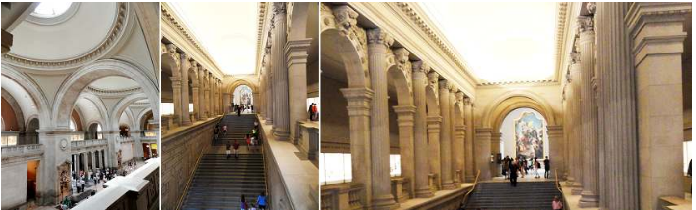
❶ Vista del hall de entrada desde el primer piso. ❷ Escalera de acceso. ❸ Con galerías porticadas a los lados de la escalera.