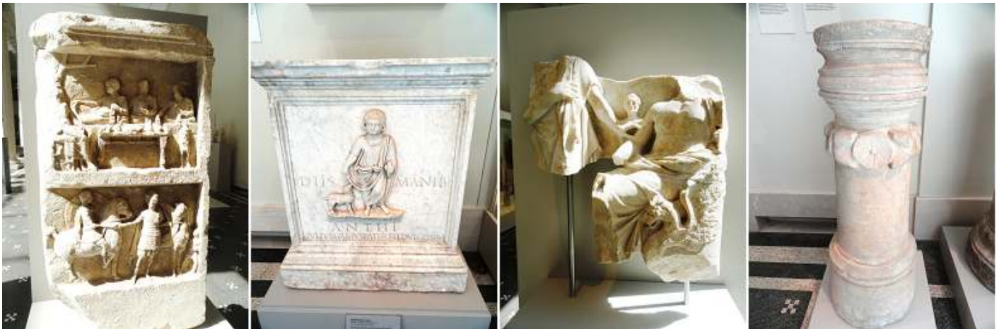
❶ Tumba de mármol, relieve con un banquete funerario. Griego helenístico. ❷ Altar funerario de mármol. ❸ Tumba estela de mármol. ❹ Limestone Cipo funerario de la tumba de Artemidoros.