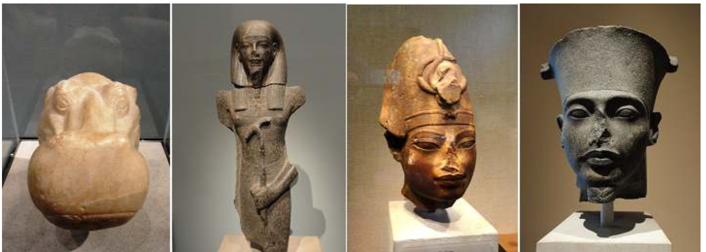
❶ Cabeza de un hipopotámo. ❷ Escultura fragmentada. 18ª Dinastía 1391-1353 a.C. ❸ Amenhotep III. 18ª Dinastía 1391-1353 a.C. ❹ Cabeza de una estatua colosal del dios Amun . 18ª Dinastía. Reinado de Tutankhamon. 1336-1327 a.C.