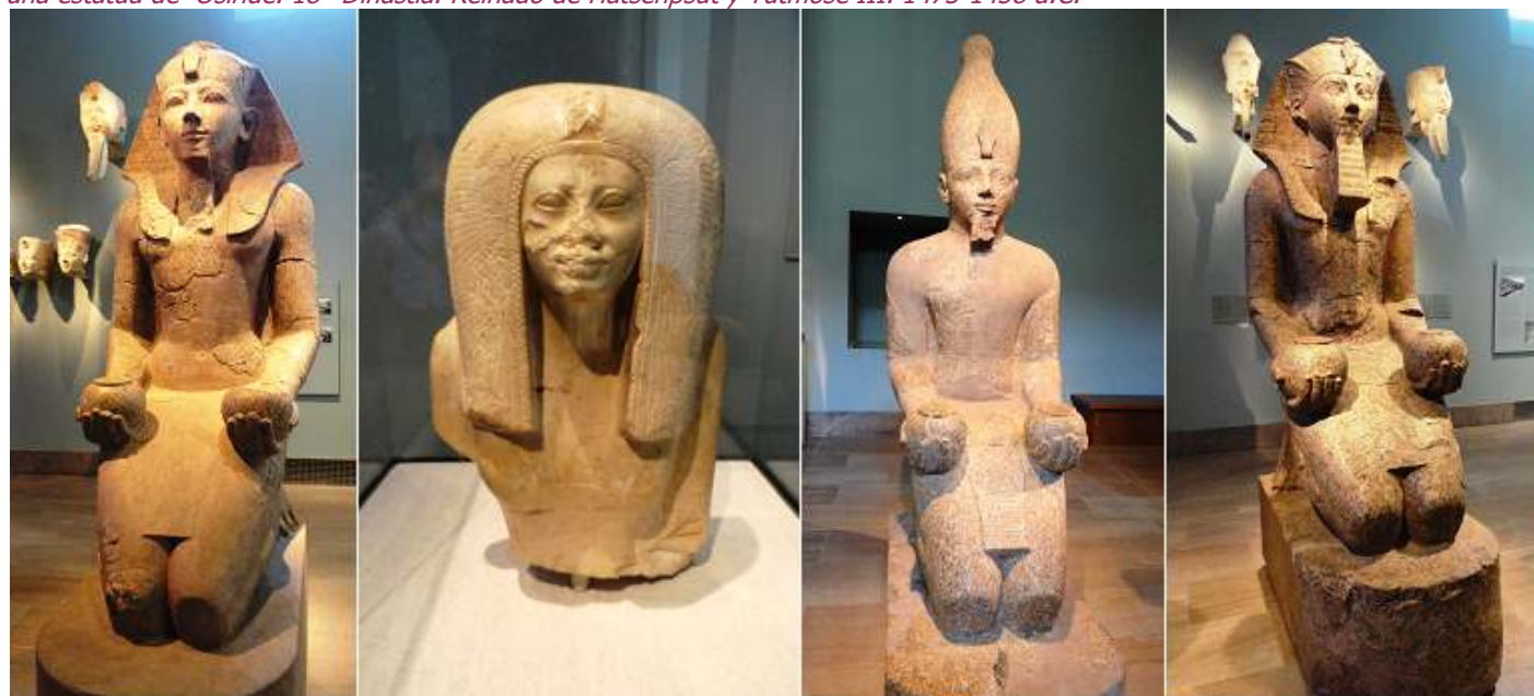
❶ La Mujer faraón de Hatshepsut. ❷ Parte superior de la estatua de una reina. 17ª Dinastía. 1580-1550 a.C. ❸ Faraón. ❹ Faraón