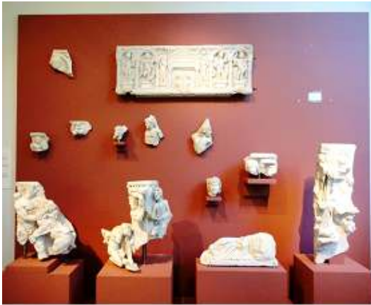
1 Vitrina con diferentes restos.