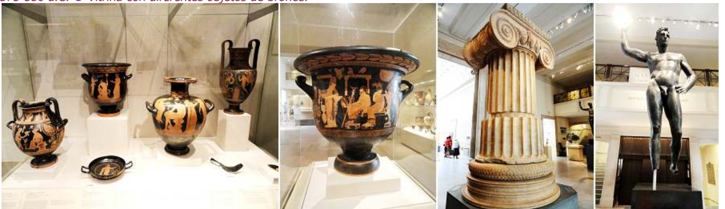
1 Vitrina con diferentes piezas de terracota griega. 2 Terracota crátera de campana. (bol).400-380 a.C. 3 Columna de mármol del templo de Artemisa at Sardis. 300 a.C. 4 Escultura