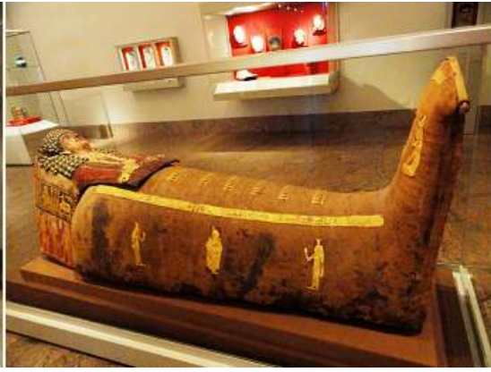
2 Vitrina con una momia.