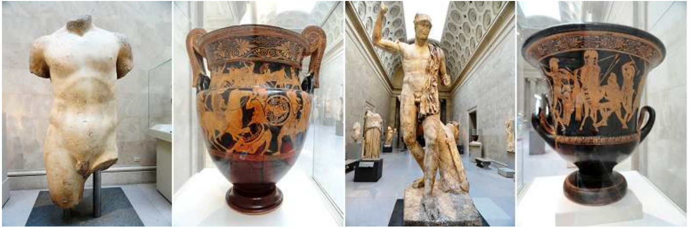
1 Torso masculino de mármol. 2 Jarrón de terracota. 450 B.C. 3 Estatua de mármol de un guerrero herido. 4 Terracota crátera-cáliz (recipiente para mezclar vino y agua) 460-450 B.C.