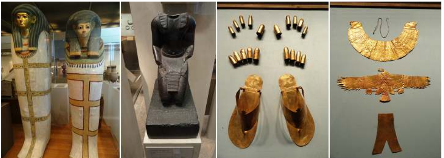
❶ Pareja de Faraón y reina. ❷ Tutmosis III, ofrenda. 18ª Dinastía. 1479-1425 a.C. Diorite. ❸ Sandalias de oro y dediles . 18ª Dinastía. Reinado Thutmose III. ❹ Más complementos de oro. 18ª Dinastía. Reinado Thutmose III.

Hatshepsut, reina-faraón de la 18ª dinastía de Egipto (5ª gobernante), llegó a ser la mujer que más tiempo estuvo en el trono.