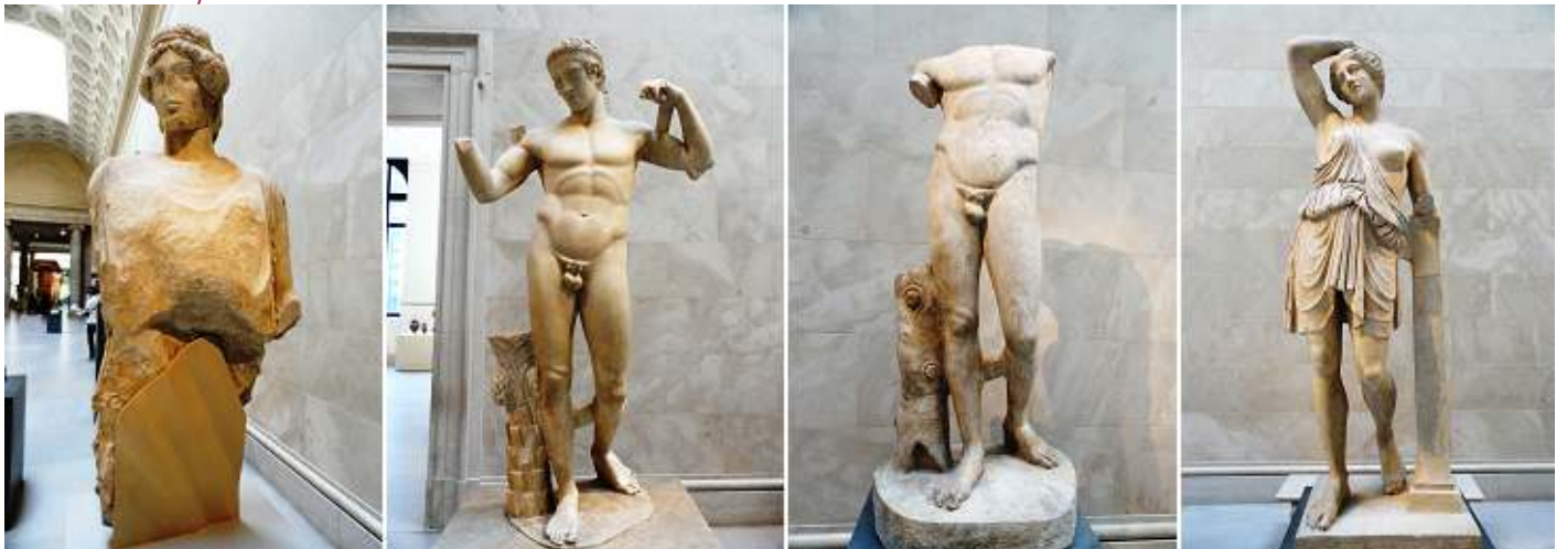
1 Parte de una estatua masculina de mármol, 460-450 B.C. 2 Estatua restaurada de Diadoumenos. 3 Estatua de Diadoumenos. 4 Estatua de mármol femenina. 450-425 B.C.