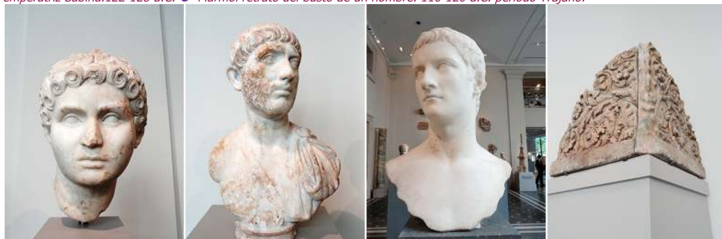
❶ Retrato de mármol de una joven . 81-96 d.C. Periodo Flaviano. ❷ Retrato de mármol del busto de un hombre. 110-138 d.C. ❸ Retrato de mármol del busto del emperador Gayo, conocido como Calígula. 37-41 d.C. ❹ Acroterion esquina con volutas de acanto. Mármol