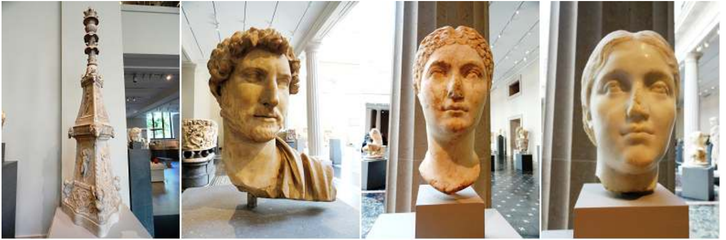
❶ Candelabro de mármol triangular. 117-138 d.C. de Villa Tivoli. ❷ Cara de mármol del emperador Adriano. 118-120 d.C. ❸ Cara de mármol de una mujer. 138-145 d.C. Periodo Antonino.. ❹ Cara de mármol de una mujer. Periodo Antonino.