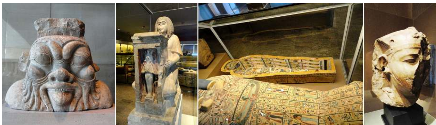
❶ Escultura. ❷ Escriba con su atril. ❸ Vitrina con nuevos sarcófagos de madera decorados. ❹ Head of Nectanebo I or II. 30ª Dinastía. 380-362 a.C. en cuarcita.