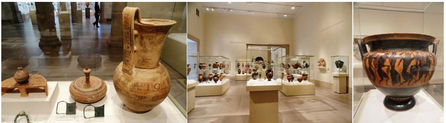
❶ Vitrina con objetos de terracota y bronce. ❷ Nueva sala ánforas y jarrones. ❸ Jarrón de terracota decorada. 550 B.C.