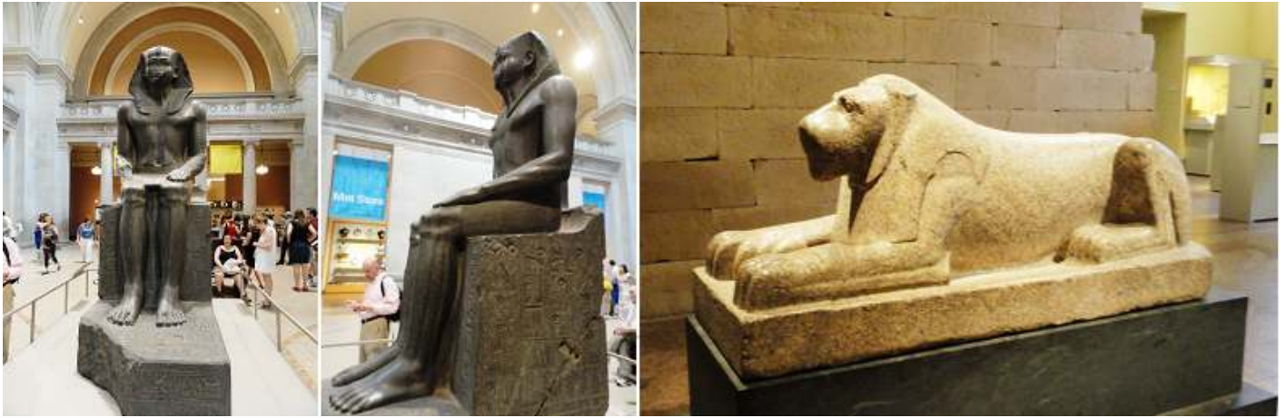
❶ - ❷ Colosal estatua del faraón. 12 dinastía reinado de Amenemhat II. 1919-1885 a.C. ❸ León de piedra postrado.