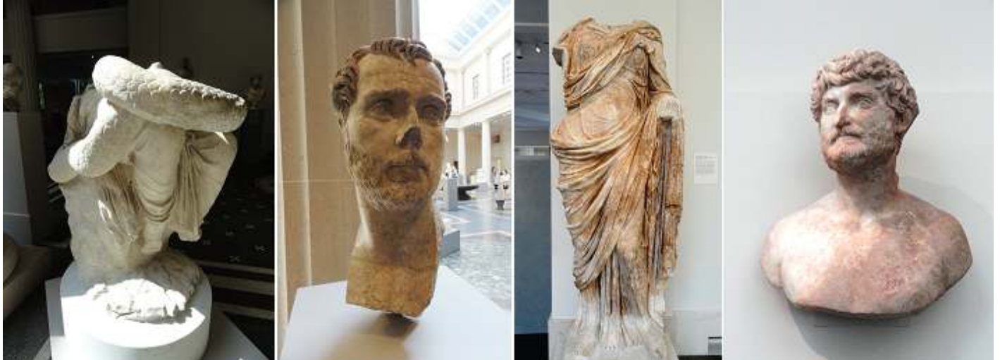
❹ Parte inferior de la estatua de mármol de Hygicia. ❺ Retrato de mármol de un hombre. ❻ Estatua de mármol de una mujer. Ⓣ Busto de mármol de un hombre barbudo.