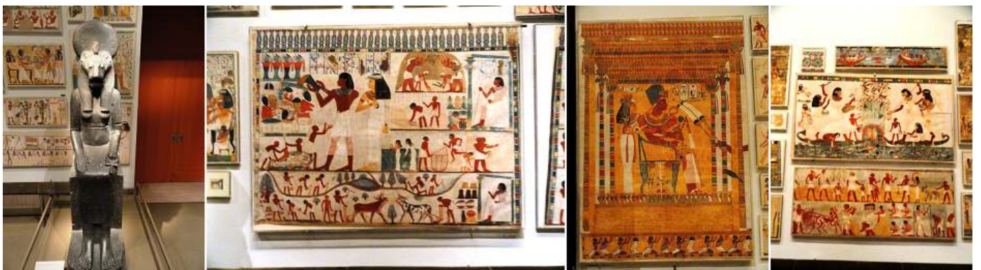
1 Estatua de la Goddess Sakhmet, 18ª Dinastía. Reinado de Amenhotep III. 2 - 3 - 4 Otras pinturas de la misma sala.