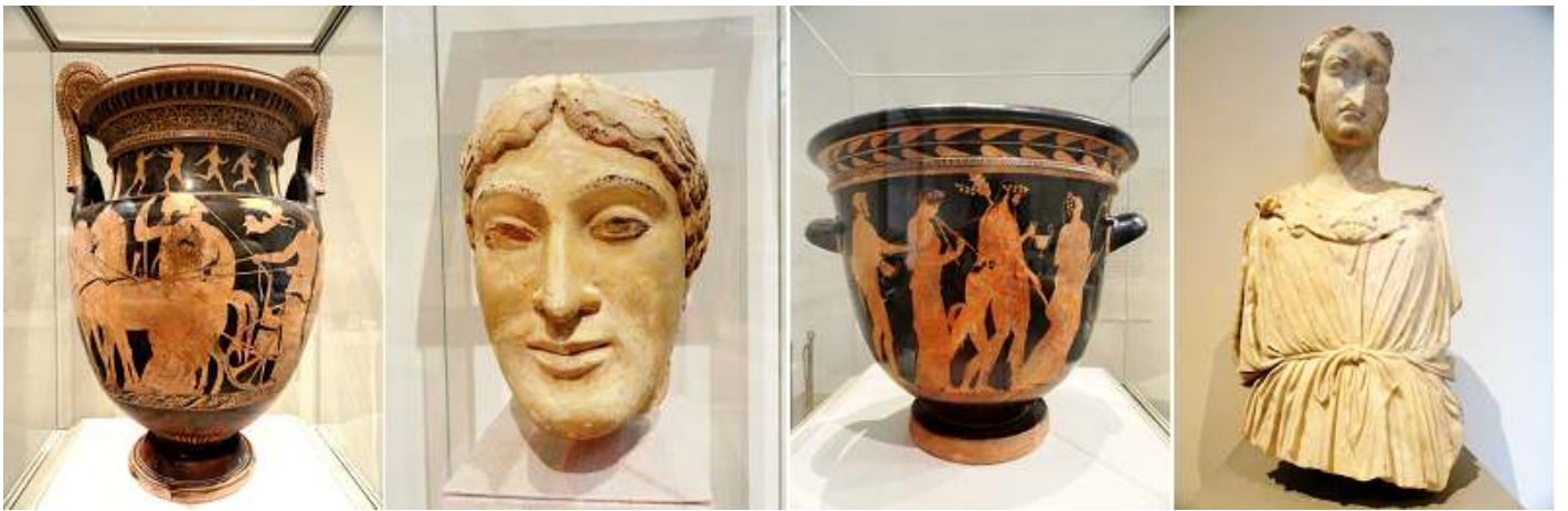
1 Terracota voluta crátera (recipiente para el vino de mezcla y con soporte) 420 B.C. 2 Cabeza de hombre de terracota. 3 Terracota voluta crátera (recipiente para el vino de mezcla y con soporte) 450 B.C. 4 La cabeza y el torso de mármol de Athena. Copia romana de una griega