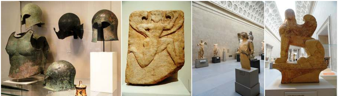
1 Vitrina con varios cascos y peto. 2 Fragmento de mármol, estela 500-490 B.C. 3 De nuevo en el corredor central. 4 Esfinge de mármol en un capitel caveto. 580.575 B.C