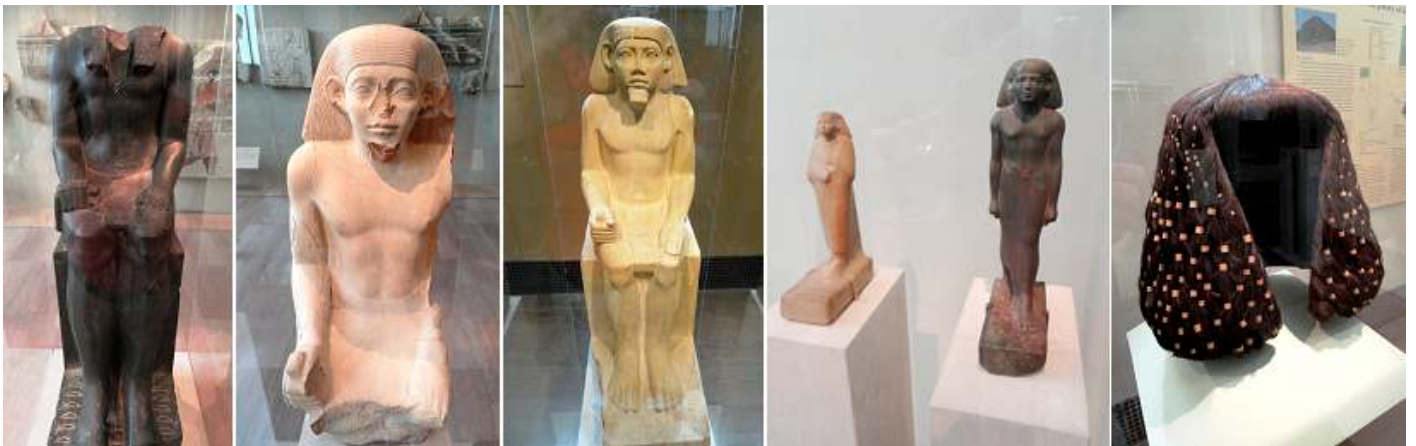
1 Escriba sentado. 2 Otra escultura de un escriba. 3 Estatua de Steward Au. 12ªDinastía Reinado de Amenemhat II. 1925-1906 a.C. 4 La figura masculina de pie en una falda escocesa Cal-Long. 12 Dinastía. 1919-1878 a.C. 5 Peluca con red y gargantillas.