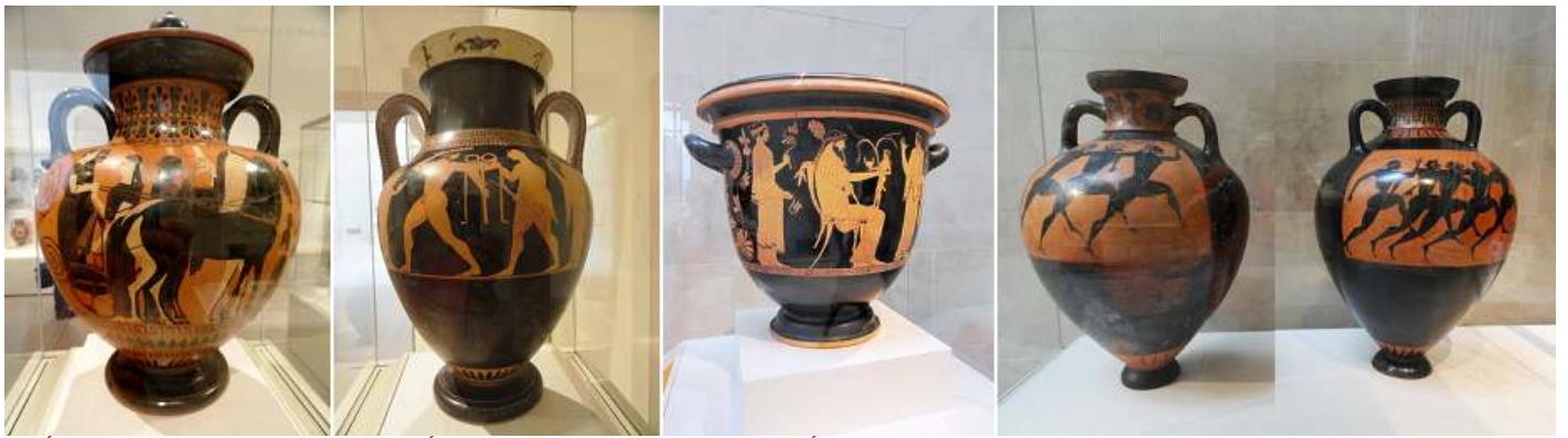
1 Ánfora de terracota 540 B.C. 2 Ánfora de terracota 530 B.C. 3 Ánfora de terracota 465-460 B.C. 4 Vitrina con dos ánforas con decoración de atletas. 560-550 B.C.