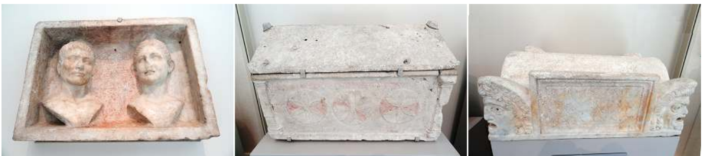
1 Porta retrato de bustos en mármol. 13 a.C. - 5 d.C. 2 Limestone with lid. 3 Tapa Mármol de un cofre cineraria 1ª centuria d.C.