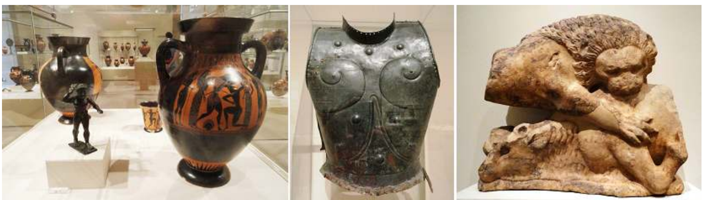
❶ Vitrina con ánforas, vaso y estatuilla de bronce de Heracles. ❷ Coraza de bronce. ❸ León devorando su pieza. 525-500 B.C.