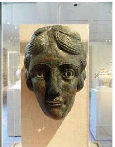
1 Cabeza de mármol de un hombre. 2 Cabeza de mármol de una mujer . 110-120 d.C. 3 Cabeza de mármol de una diosa, posiblemente Venus . Periodo imperial. 4 Bronce máscara de deportes de caballería.