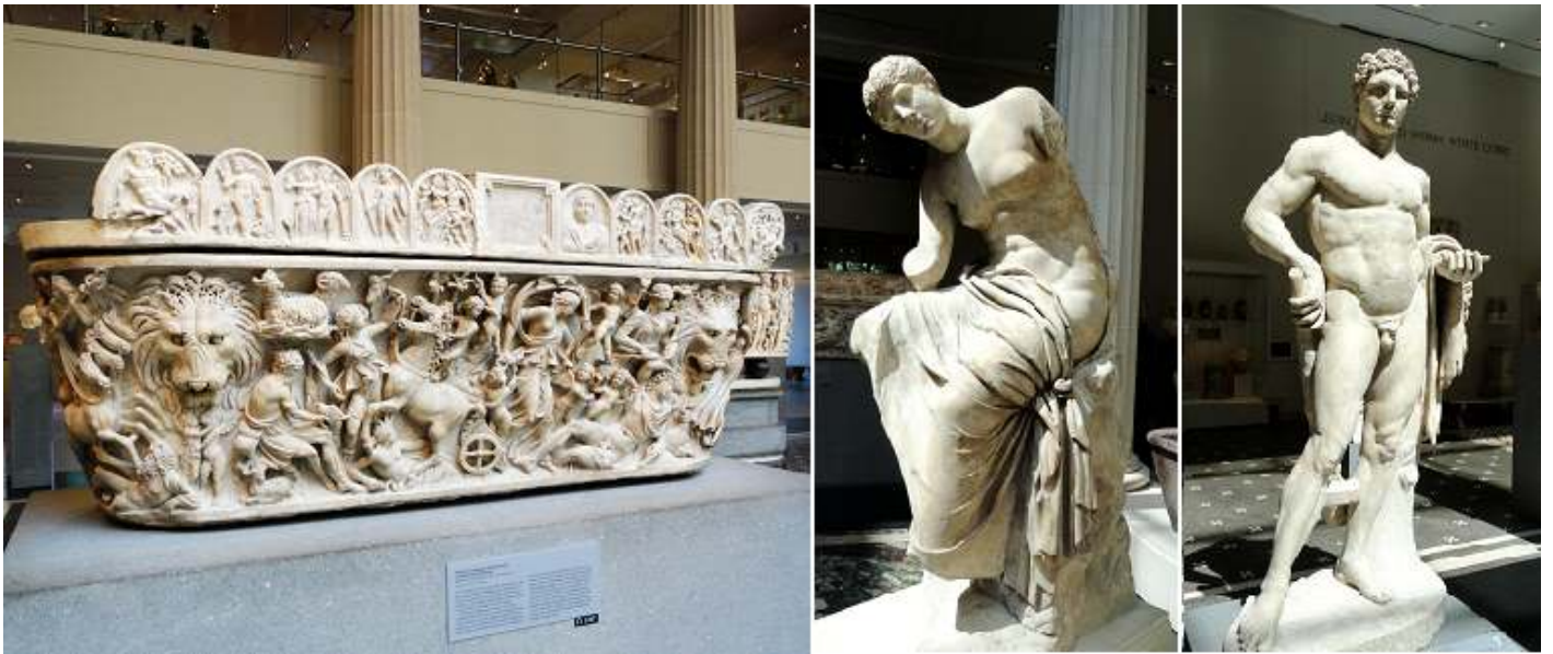
❶ Sarcófago de mármol con el mito de Selene y Endimión. Periodo Severo. ❷ Estatua de mármol de una musa. Periodo imperial. ❸ Estatua de mármol de Hércules juvenil. 68-98 d.C.