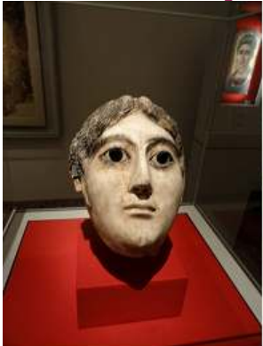
1 Máscara de una mujer con una gran bobina de trenzado de cabello. 117-138 d.C.