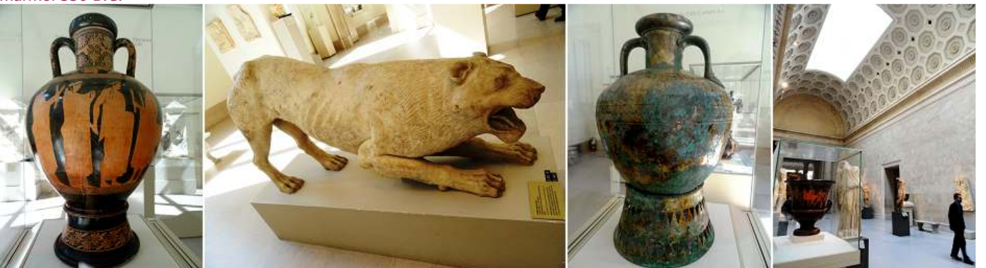
❶ Ánfora de terracota pintada. 470B.C. ❷ Estatua de un león 400-390 B.C. ❸ Ánfora de bronce. 500-450 B.C. ❹ Vista de una sala.