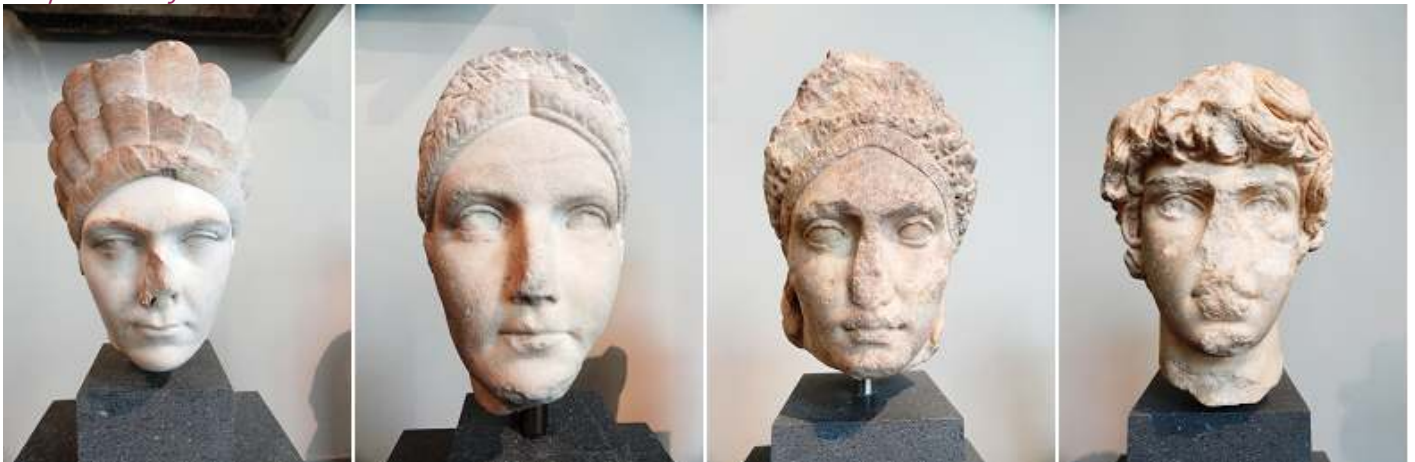
❶ Retrato de mármol de Marciana, hermana del emperador Trajano, 130-138 d.C. periodo Hadriánico. ❷ Retrato de mármol, probablemente de Matidia, mujer del emperador Adriano. 117-138 d.C. periodo Hadriánico. ❸ Retrato de mármol sobre el tamaño real, probablemente de la emperatriz Sabina. 121-128 d.C. periodo Hadriánico. ❹ Mármol en vertical de la cabeza de Antinoos . 130-138 d.C.