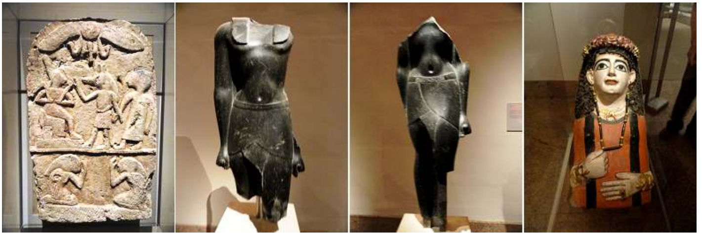
1 Estela funeraria. Abydos. 2 Torso 332-30 a.C. 3 Torso del rey Ptolemaic. 80-30 a.C. 4 Momia Máscara de una mujer con una guirnalda Jeweled. 60-70 d.C.