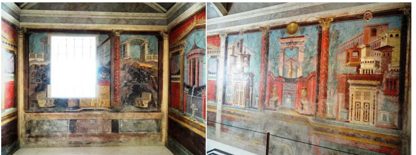
1 - 2 Dos tomas en detalle de esta recepción de los años 50-40 a.C.

Más muestras de esta lujosa villa del periodo republicano, que el año 79 fue enterrada por la erupción del Vesubio y así conservada, su descubrimiento en 1899 y un importante número de estas adquiridas por el Metropolitan en 1903.