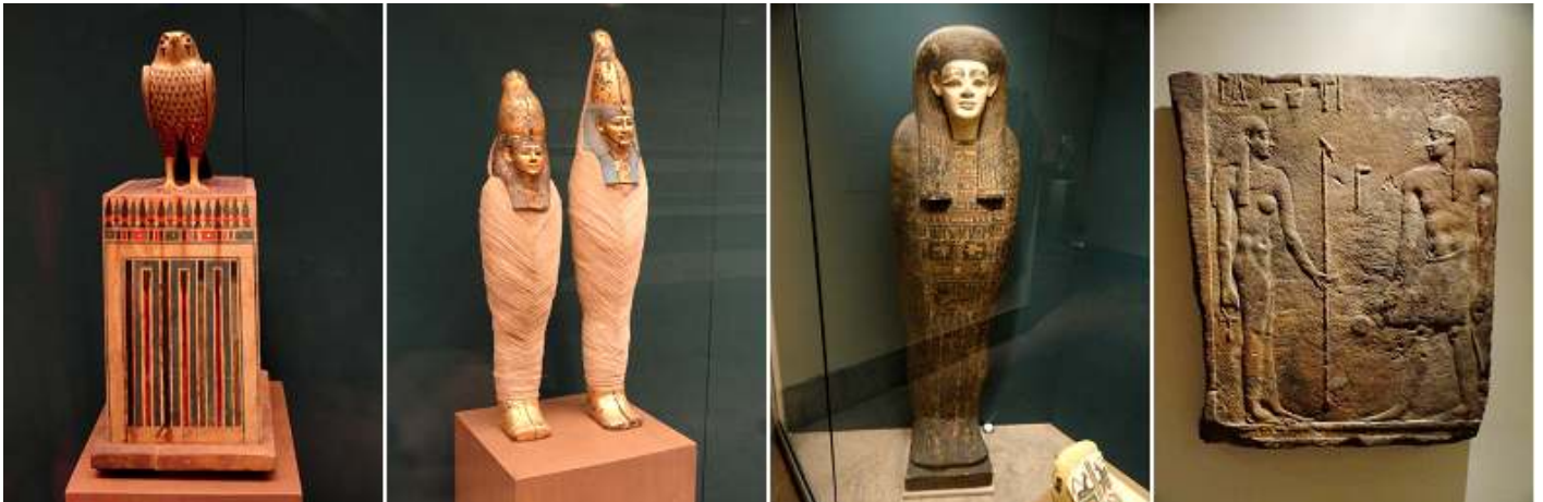
1 Estatuilla con la representación de Orus. 2 Dos figuritas momificadas. 3 Sarcófago. 4 Representación de una ceremonia, 30ª Dinastía. Periodo Ptolemaico. 380-246 a.C.