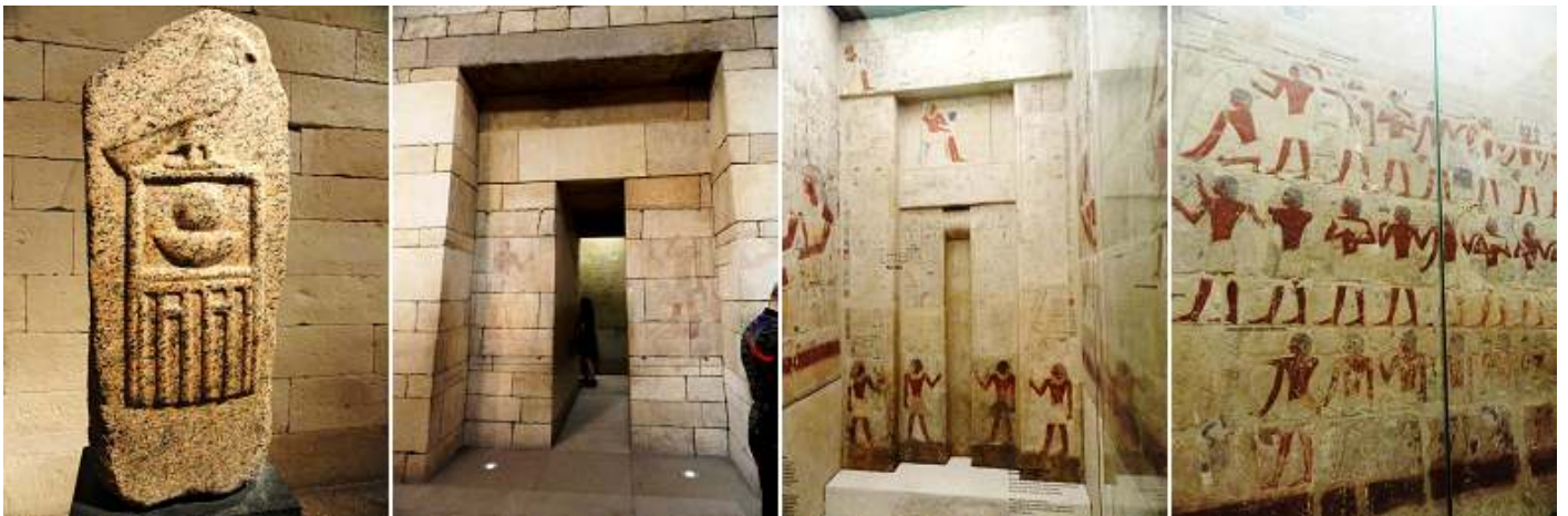
❶ Gran losa con Orus en la parte superior ❷ m Una de sus puerta de la tumba, con signos en su exterior de pinturas. ❸ Pinturas de la primera cámara. ❹ Otro detalle de esta misma cámara. Saqqara, se encuentra a 32 km, al sur de Gizeh. Interesante por sus mastabas, donde se encuentra enterrados faraones y nobles de las dos primeras dinastías.

Y en esta sala se encuentra la tumba de Perneb de Saqqara. 2381-2323 a.C. Perneb era un oficial de la corte durante el reinado de Djedkare Isefi y Unas. Su mastaba está compuesta por una capilla decorada y otra cámara (además disponía de otra subterránea)