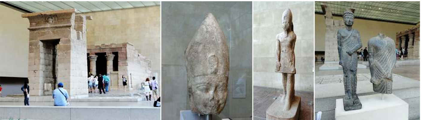
1 Templo Dendur. 2 Tutmosis III. 18ª Dinastía. 1438-1425 a.C. Templo de Montu 3 Tutmosis III. 18ª Dinastía. 1438-1425 a.C. 4 Figura masculina con diadema.