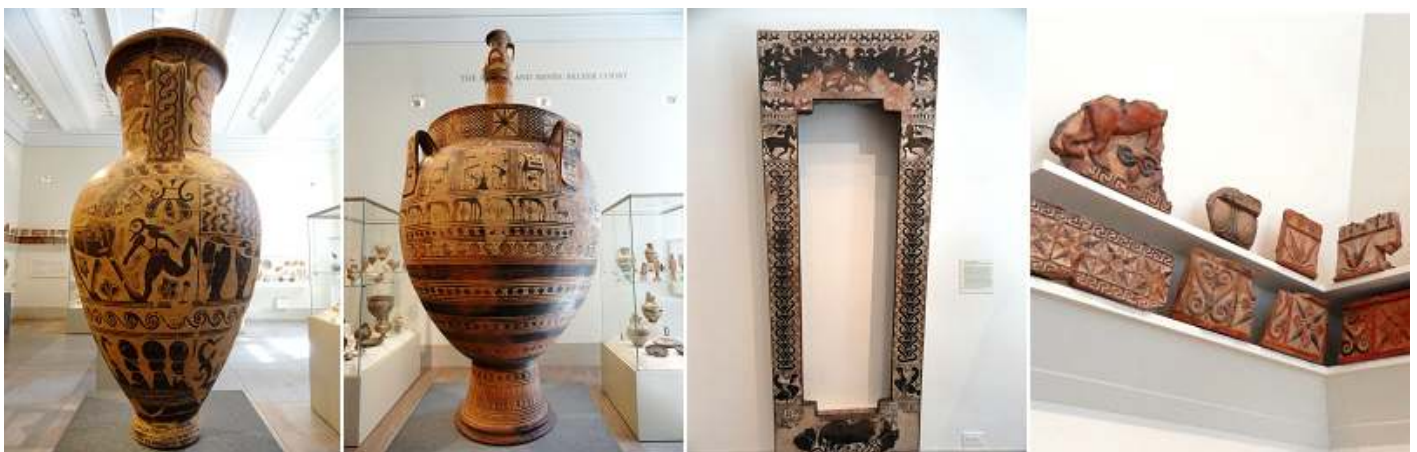
1 Ánfora de terracota decorada. 2 Terracota crátera con una tapa coronada por un pequeño. 3 Sarcófago de terracota. 4 Fragmentos murales de tarracota.