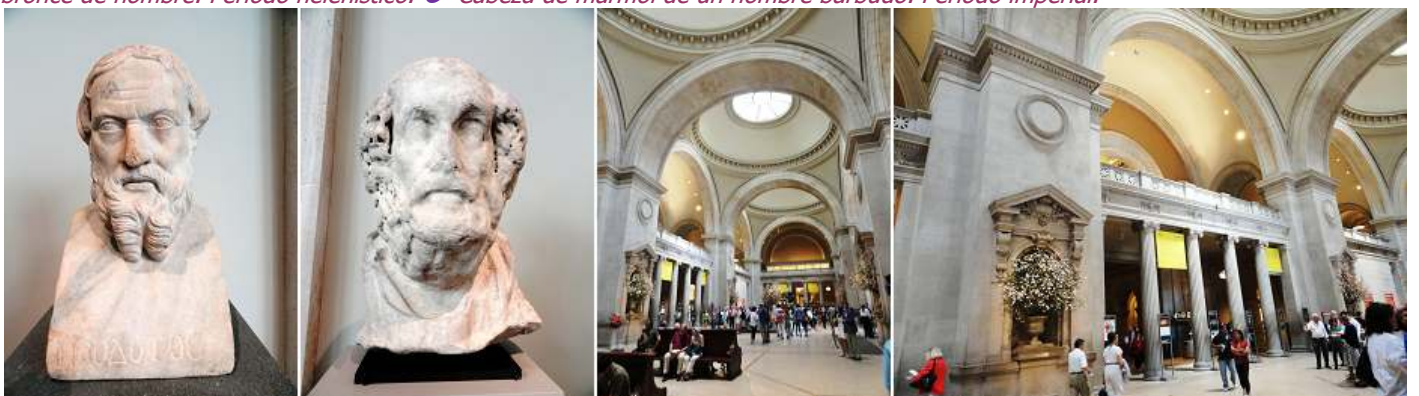
1 Cara de mármol de Heterodoto. Periodo imperial. 2 Cabeza de mármol de un varón. Periodo imperial. 3 Concluimos la visita del arte Romano. 4 Y nos trasladamos a las salas del arte egipcio.