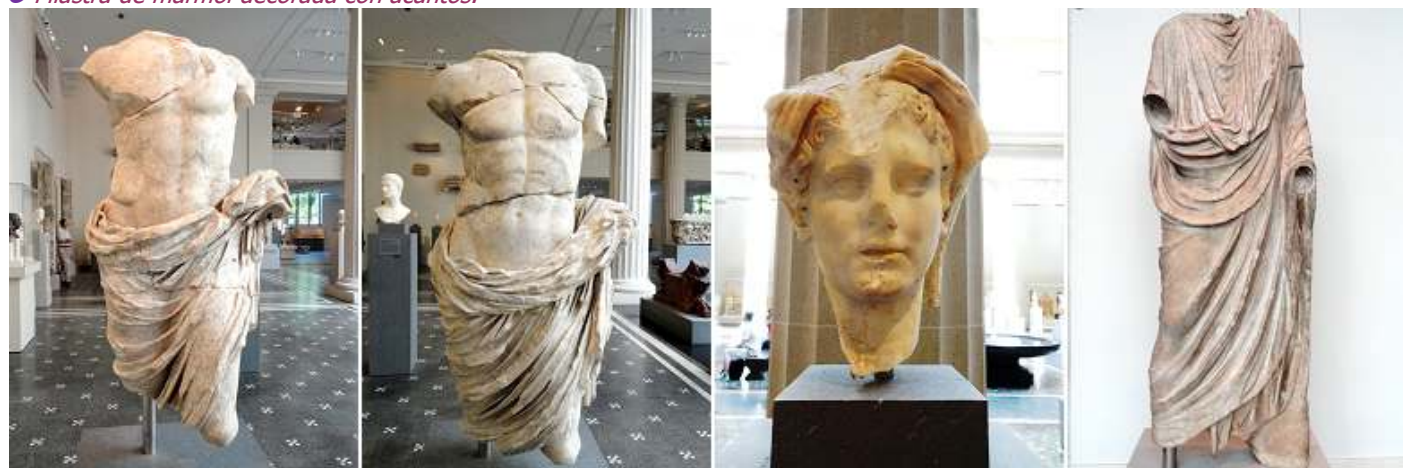
❶ Estatua de mármol de un miembro de la familia imperial. 27 a.C. – 68 d.C. ❷ Estatua de mármol de un miembro de la familia imperial. 27 a.C. – 68 d.C. ❸ Cabeza de mármol de un hombre con velo. Periodo Julio - Claudio. ❹ Estatua de mármol de un togatus (hombre que llevaba una toga). Periodo Augusto.