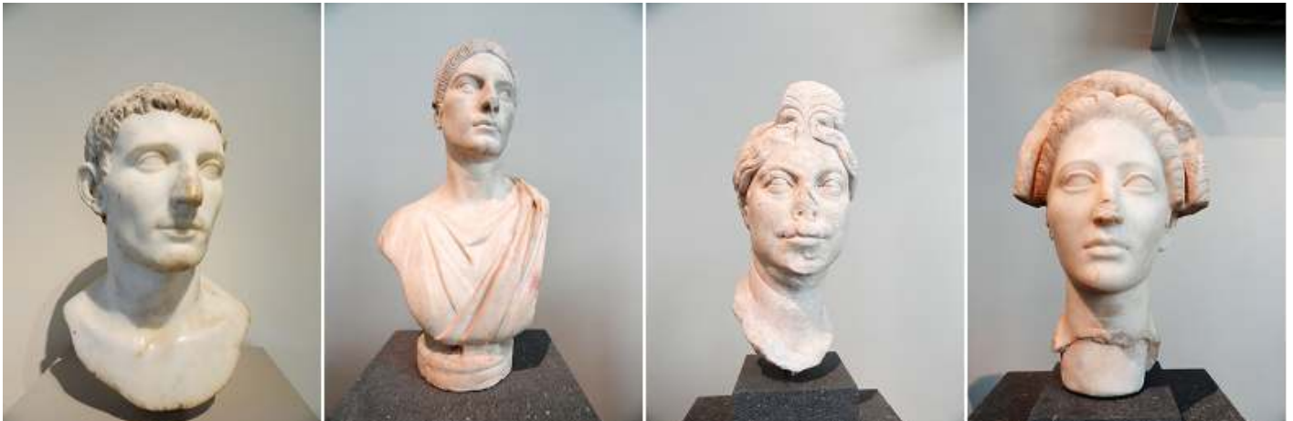
❶ Auto retrato de mármol de un varón 81-96 d.C. periodo Flaviano. ❷ Auto retrato de mujer en mármol. 100-120 d.C. periodo Trajano. ❸ Retrato de mármol de una mujer. 110-120 d.C. periodo Trajano. ❹ Retrato de mármol de una mujer joven. 98-117 d.C. periodo Trajano.