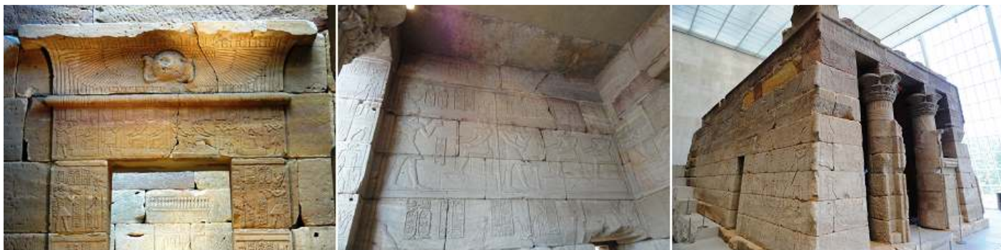
❶ Portada del santuario. Que como la piona esta la representación del sol con alas, del dios Horus. ❷ Detalle del pórtico. ❸ Imagen exterior del lateral izquierdo.

En su reinstalación en el museo, se persiguió la representación del lugar de su ubicación ante el Nilo, y el muro de rocas en su parte trasera y la gran explanada para el culto.