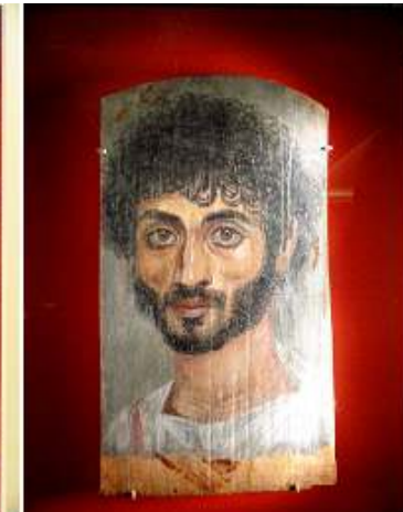
3 Fragmento con un hombre barbudo.