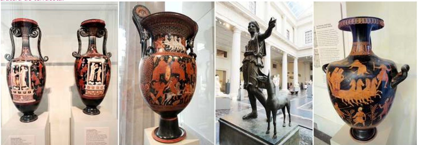
❶ Terracota loutophoros. ❷ Terracota volute cratera. 320-310 a.C. ❸ Estatua de bronce de Artemis y un ciervo. Griego o Romano. ❹ Terracota cántaro de agua 340-330 a.C.