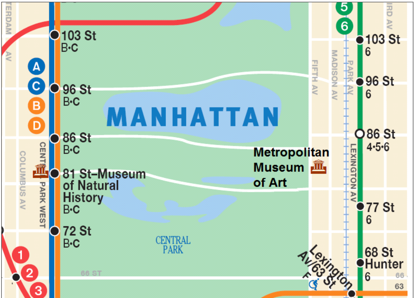
Croquis situación museo, plano empleado de las líneas de metro.