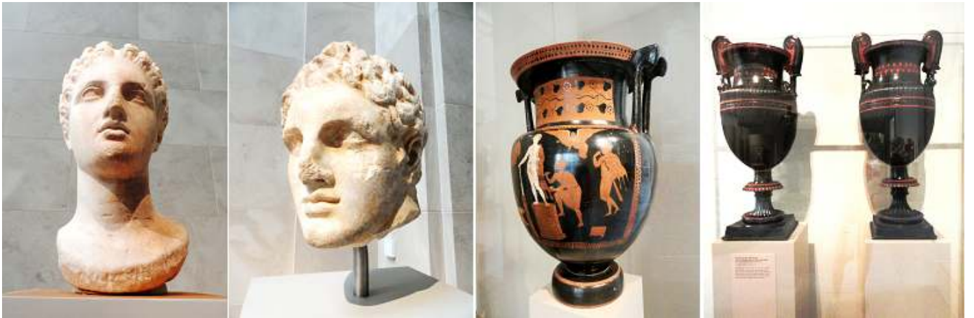
❶ Cabeza de mármol de una diosa. ❷ Cabeza de mármol de un joven. ❸ Terracota voluta crátera . 360-350 a.C. ❹ Pareja voluta crátera de terracota.