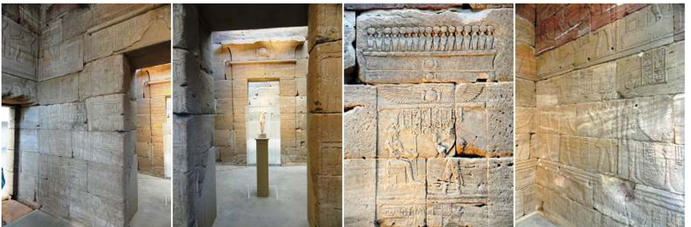
❶ El tagerem sacerdotisa. Periodo Ptolemaico. Reinado de Ptolemy I y Ptolemy II. 306-246 a.C. ❷ Sala del santuario con imágenes del culto. ❸ Otra imagen de sus muros.

La sala central el lugar de las ofrendas, y a continuación la última sala, el santuario de Isis, los relieves que contiene en su interior estuvieron pintados con colores, hasta su lavado por la construcción de la primera presa de Asuán.