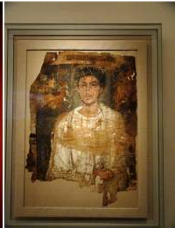
4 Fragmento con un hombre joven.