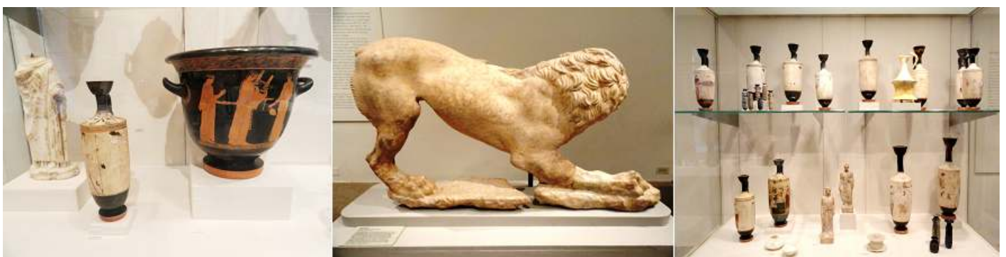
1 Vitrina con varias piezas. 2 León de mármol. 3 Vitrina con un surtido de pequeñas ánforas y dos