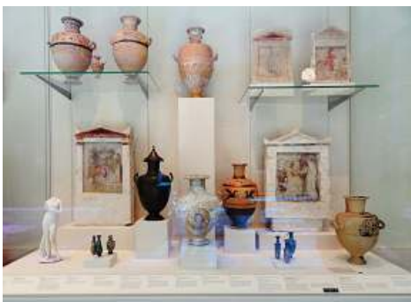
❶ Diferentes objetos