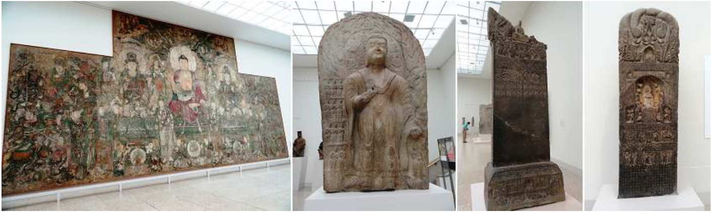
❶ Gran mural. ❷ Buda Dipankara. Dinastía Wei. 384-535. ❸ Stele Commissioned by Helian Ziyue. Dinastía Wei. 535-550. ❹ Sele ei. 386-534.