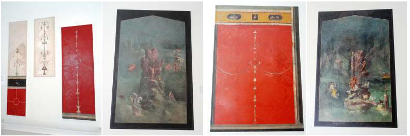
1 Seis pinturas de una habitación dormitorio 2 Pintura de otra habitación dormitorio 3 Otra pintura de pared de la misma villa. 4 y otro ejemplo de pintura.

Diferentes pinturas murales de la villa de P. Fannius Synistor at Boscoreale, con numerosas habitaciones, y dos patios con un amplio pórtico.