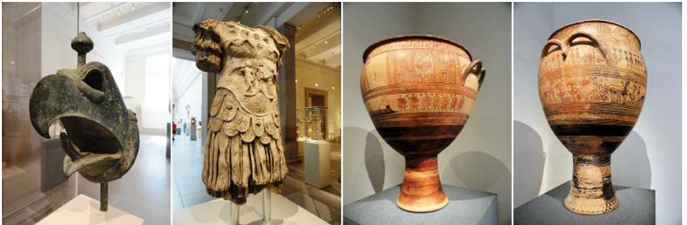
❶ Cabeza de bronce de un grifo. ❷ Torso de una estatua de mármol de emperador. ❸ Ánfora de terracota. ❹ Ánfora de terracota 750-735 B.C

A primera hora, es la indicada para visitarlo por el número de visitantes.