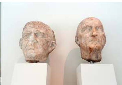
❷ Dos cabezas retrato de mármol.