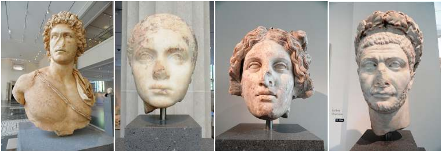
❶ Mármol retrato del busto de un hombre joven . ❷ Retrato de mármol de una mujer joven. 139-150 d.C. ❸ La cabeza de mármol de una deidad. ❹ Retrato de mármol de un emperador 250-284 d.C.