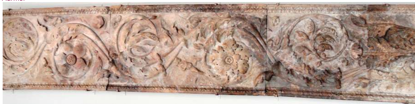
❶ Pilastra de mármol decorada con acantos.