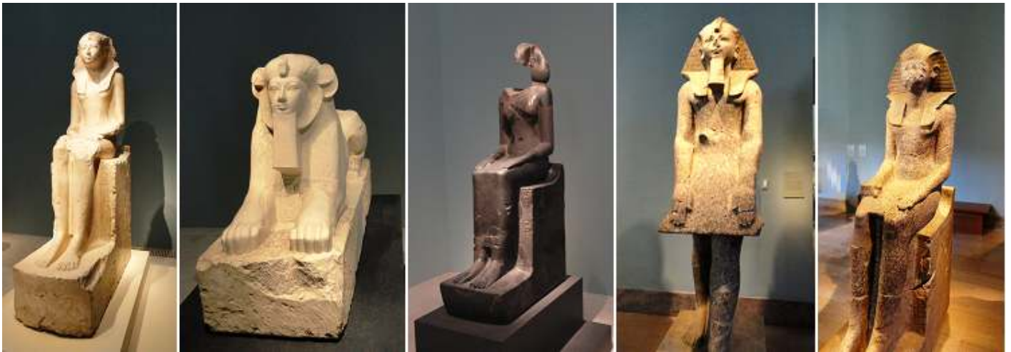
❶ Hatshepsut sentada. ❷ Hatshepsut como esfinge Maned . ❸ Hatshepsut llevaba el tocado khat . ❹ Hatshepsut en una actitud devocional. Granito. ❺ Gran estatua sedente de Hatshepsut. granito.

Hatshepsut, reina-faraón de la 18ª dinastía de Egipto (5ª gobernante), llegó a ser la mujer que más tiempo estuvo en el trono.