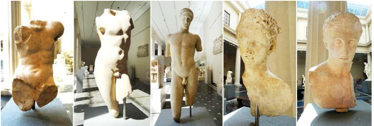
1 Mármol torso de un hombre sentado. 2 Mármol torso de un joven. 3 Estatua de mármol de "Stephanos Young". Periodo Imperial temprano. 4 La cabeza y parte de la estatua de mármol de un sátiro. 5 Busto de mármol de un joven.