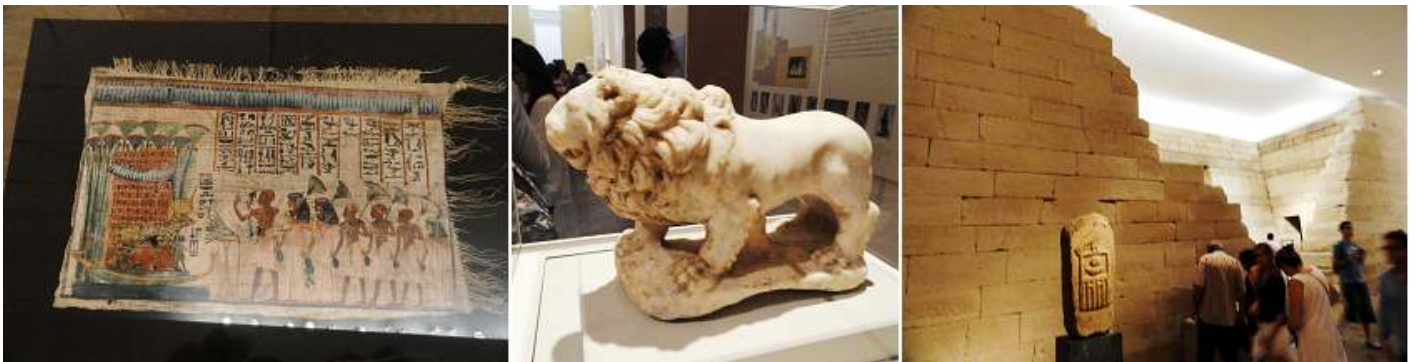
❶ Textil en honor a la diosa Hathor 19 Dinastía. 1.300-1.250 a.C. ❷ Estatuilla de un león de mármol. ❸ Mastaba de Saqqara. Esta fachada y su cámara fueron compradas al gobierno egipcio en 1913.

Y en esta sala se encuentra la tumba de Perneb de Saqqara. 2381-2323 a.C. Perneb era un oficial de la corte durante el reinado de Djedkare Isefi y Unas. Su mastaba está compuesta por una capilla decorada y otra cámara (además disponía de otra subterránea)