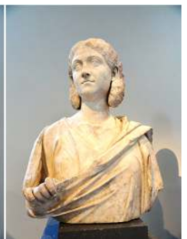
❶ Estatua de bronce del emperador Treboniano Gallus. 251-253 d.C. ❷ Mármol, lado derecho corto de un sarcófago. ❸ Mármol retrato del busto de una mujer. ❹ Busto de mármol de una mujer.