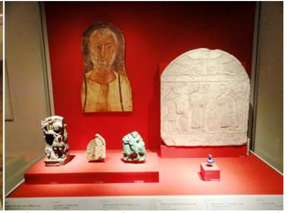
3 Vitrina con diversas piezas y fragmentos y una pintura a la