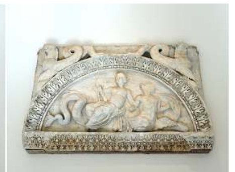
❸ Exquisita pieza de mármol.