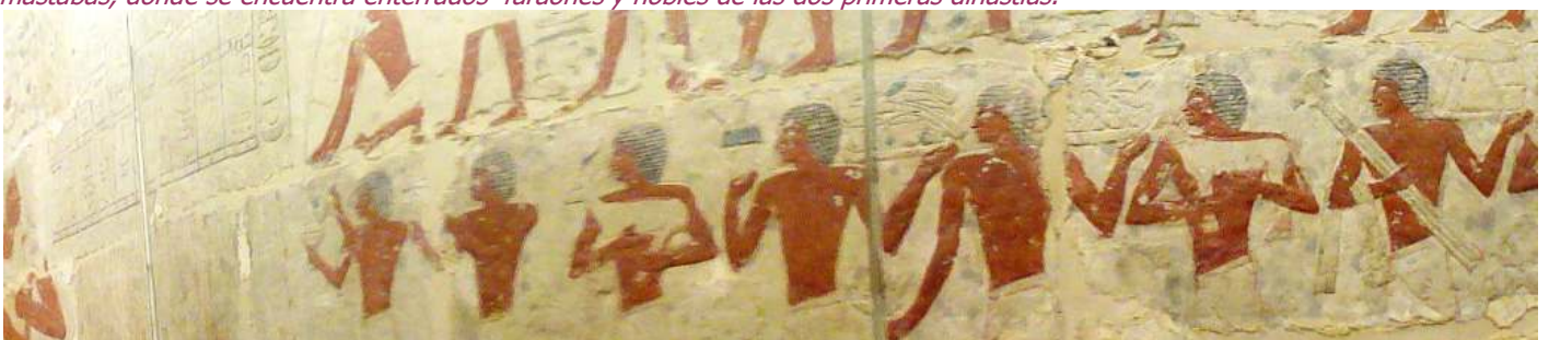
❶ Secuencia de una de sus pinturas interiores.