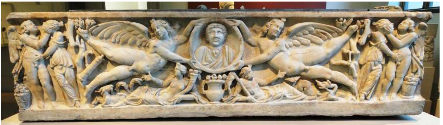
❶ Sarcófago de mármol con un retrato cípeo. 190-200 d.C.