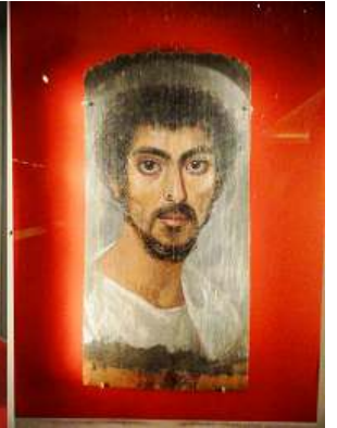
4 Fragmento con un hombre barbudo. 160-180 d.C.