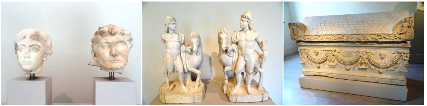
❶. Dos cabezas retrato de mármol. ❷ Estatuillas de mármol de Cástor y Pólux. ❸ Sarcófago de mármol con guirnaldas.