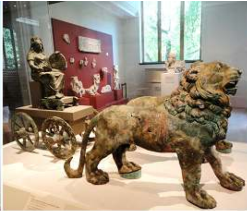
2 Estatua de la Cibeles, con un carro tirado por leones.