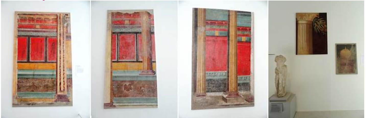
1 - 2 Otra de las habitaciones 3 Detalle del sentido de la profundidad en las columnas. 4 Otras muestras de pinturas.