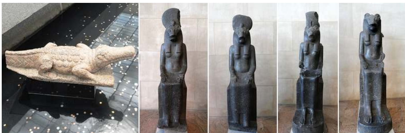
❶ Cocodrilo de granito en el estanque ❷ - ❸ - ❹ - ❺ Cuatro estatuas de Sejmet Golddess. . 18ª Dinastía. Reinado de Amenhotep III. 1390-1352 a.C.