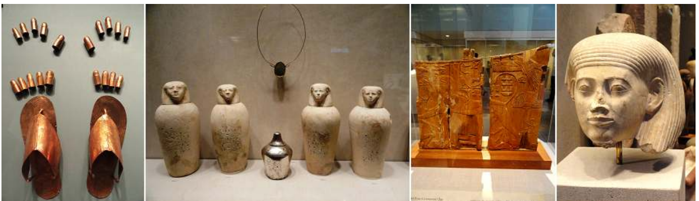
❶ Equipos funerarios pertenecientes a tres esposas extranjeras de Tutmosis III. ❷ Vasijas funerarias. ❸ Panel brazo de una silla ceremonial . 18ª Dinastía. Tebas. Reinado Thutmose IV 1400-1391 a.C. ❹ La cabeza de un dios. 18ª Dinastía Reinado Amenhotep II. 1427-1400 a.C.