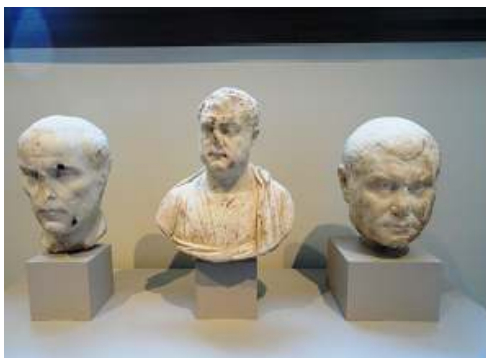
❶ Tres bustos de mármol.