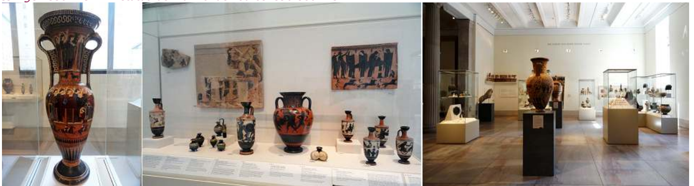
1 Terracota ceremonial. 2 Terracota atyballos (la ánfora central) 3 Otra vista de la sala.