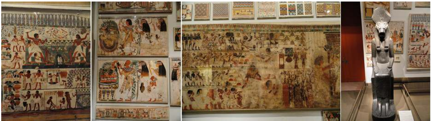
1 - 2 - 3 Diferentes muestras de pinturas de esta sala. 4 Estatua de la Goddess Sakhmet, 18ª Dinastía. Reinado Amenhotep III.