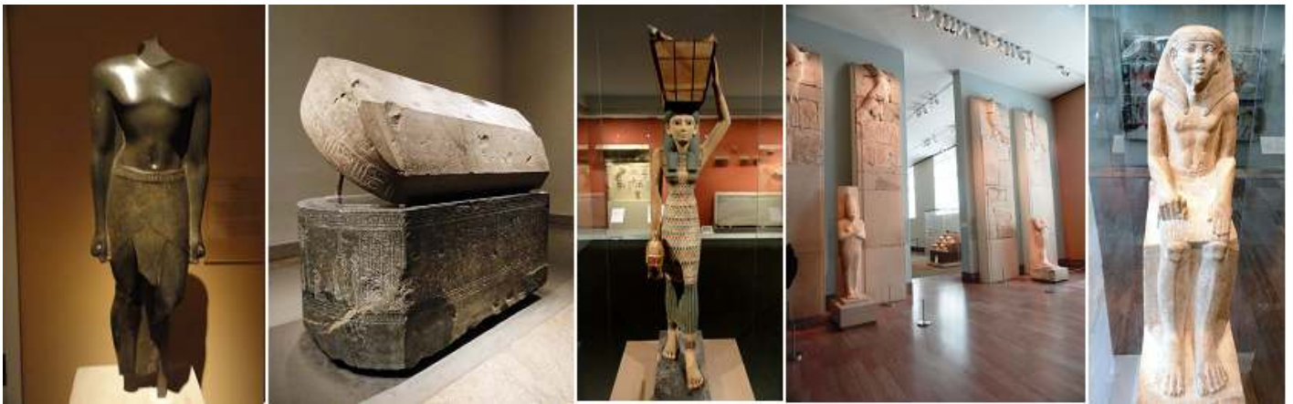
1 El General Tjahapimu. 30ª Dinastía. Reinado de Nectanebo II 360-343 a.C. 2 Sarcófago de granito. 30ª Dinastía. 380-342 a.C. 3 Offering Bearer. 13ª Dinastía. reinado de Amenemhat I 1883-1975 a.C. 4 Una nueva sala. 5 Escultura de un escriba sentado.