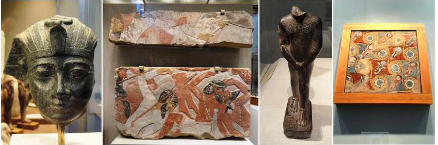
❶ Amenhotep II. 18ª Dinastía 1427-1400 a.C. ❷ Dos relieves de escenas de batallas . Probable reinado de Amenhotep II. ❸ Figura de Amenhotep III. 18ª Dinastía 1391-1353 a.C. ❹ ¿?.

Tutmosis III, fue el 6º gobernante de la 18ª dinastía, además de uno de los más importantes y poderos de los monarcas durante los 3.000 años de la civilización faraónica.