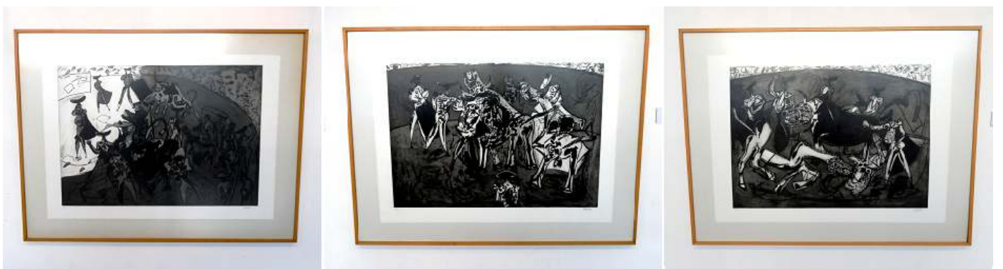
1 Tauromaquia. 1993. 2 Tauromaquia. 1993. 3 Tauromaquia. 1993.