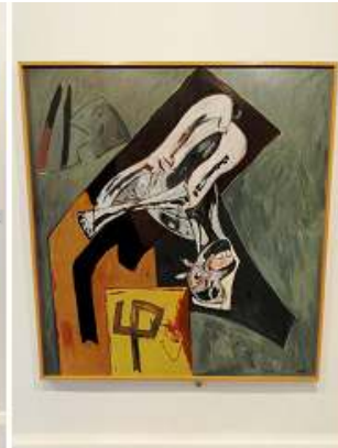
3 Momento dramático. 1991.