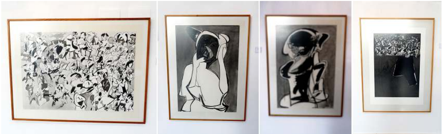
1 Gentes. 1980. 2 Mujer pensante. 1986. 3 Mujer tocándose. 1986. 4 Palco. 1993.

Durante su vida ilustró numerosos libros, como la Tauromaquia de Rafael Alberti (1970) o Tauromaquia y destino de Antonio Gamoneda (1980).