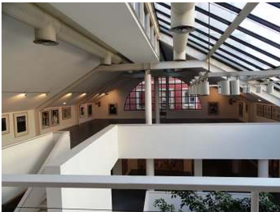
1 Perspectiva de la última planta.