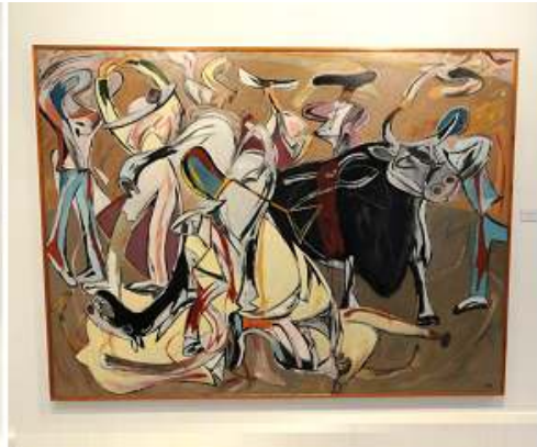
2 Tauromaquia. 1988.