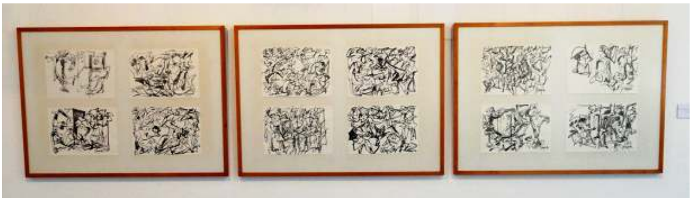
1 Cuatro dibujos automáticos. 1987.