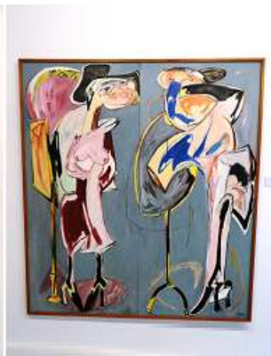
2 Camerino (Díptico). 1986.