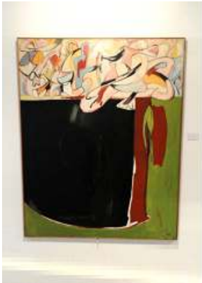
1 Palco. 1984.