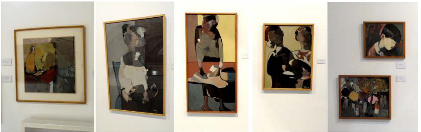
1 Fragmento nº 5. 1962. 2 Niña con pez y plato. 1959. 3 Dos figuras. 1958. 4 Planchadora. 1959. 5 Cabeza de Niño. 1955. 6 Mercado. 1954.