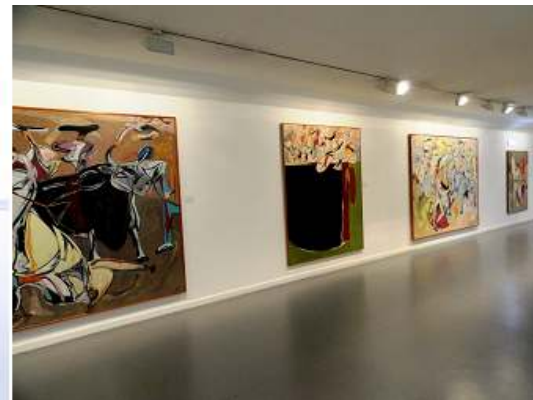
3 Detalle de esta sala.