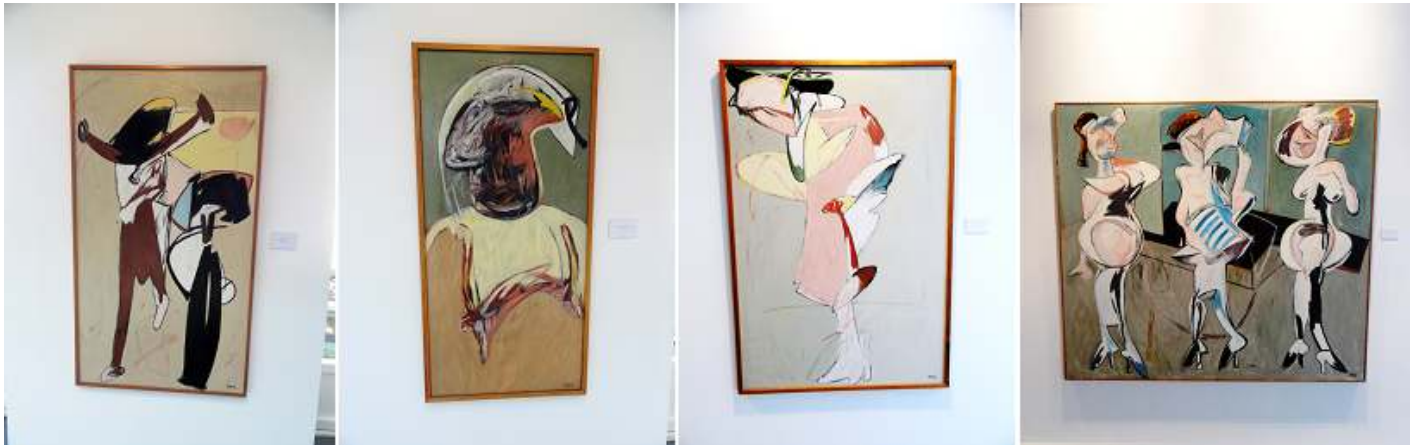
1 La Comba 1984.

Comenzamos con la muestra de Barjola que algunos críticos la incluyen dentro de la nueva figuración .