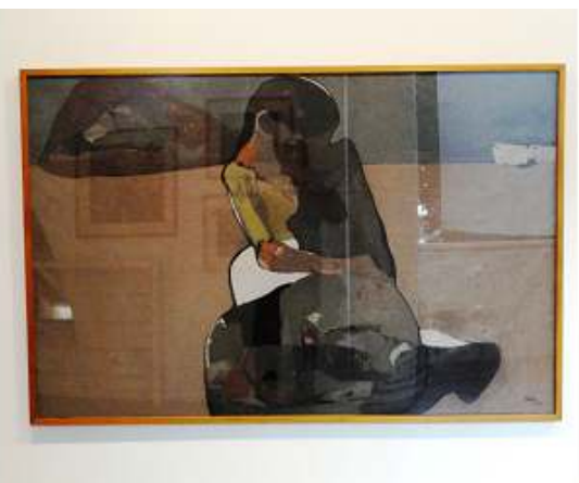
3 Pescadora. 1958.