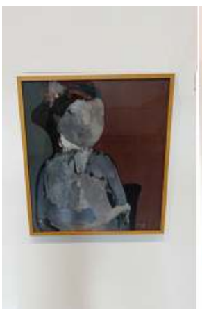
1 Retrato apócrifo. 1963.