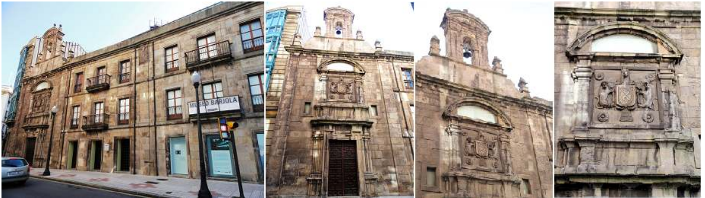
① Fachada del conjunto de la capilla y el palacio. ② Portada barroca de la capilla con una espadaña. ③ La parte central con el escudo y un frontón curvo. ④ El escudo de los Jove sostenido por dos leones entre pilares

El palacio de los Jove Huergo es una construcción del S. XVII de tres plantas muy deteriorado y adosado a él se encuentra la capilla de La Trinidad. Tras su total renovación de este edificio histórico, pues del palacio solo quedó la estructura de su fachada, se inauguró este museo el 16 de diciembre de 1986.