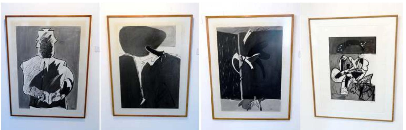
1 El Magistrado. 1980. 2 Fisura blanca. 1986. 3 Puerta cerrada. 1979. 4 Nube, personaje y perro. 2004.