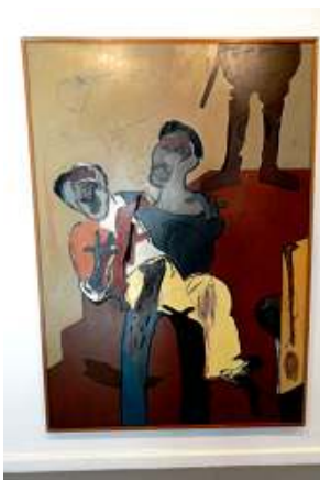
1 Tercer mundo. 1976.