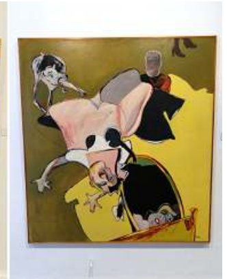
4 Momento erótico. 1974