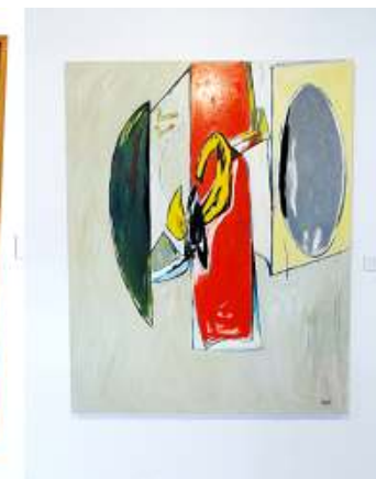
3 Espejos. 1964.