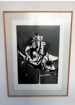
2 Cabeza de toro. 1993.