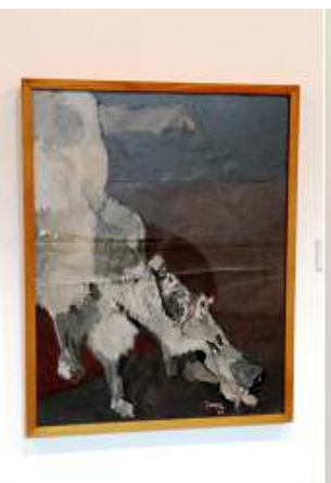
2 Fragmento de perro. 1962.