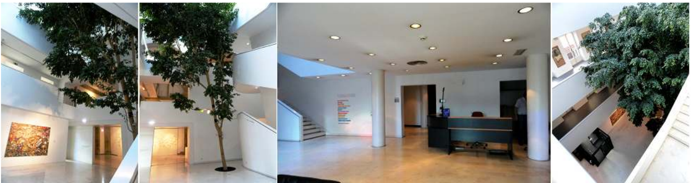
① Zona de entrada al fondo el acceso a la capilla. ② Junto a la escalera de acceso a las planta superiores un gran árbol. ③ Recepción. ④ Desde la última planta

La capilla de nave única con bóveda de arista y su presbiterio con cúpula con pechinas con los cuatro evangelistas, en estilo barroco. Y a su derecha está la casa palacio de dos cuerpos con tres plantas. En el centro de estos dos bloques enmarcado por sendas columnas rectas está el escudo de los Hevia, Miranda y Lavandera Valdés. Hoy es la sede del museo Barjola.