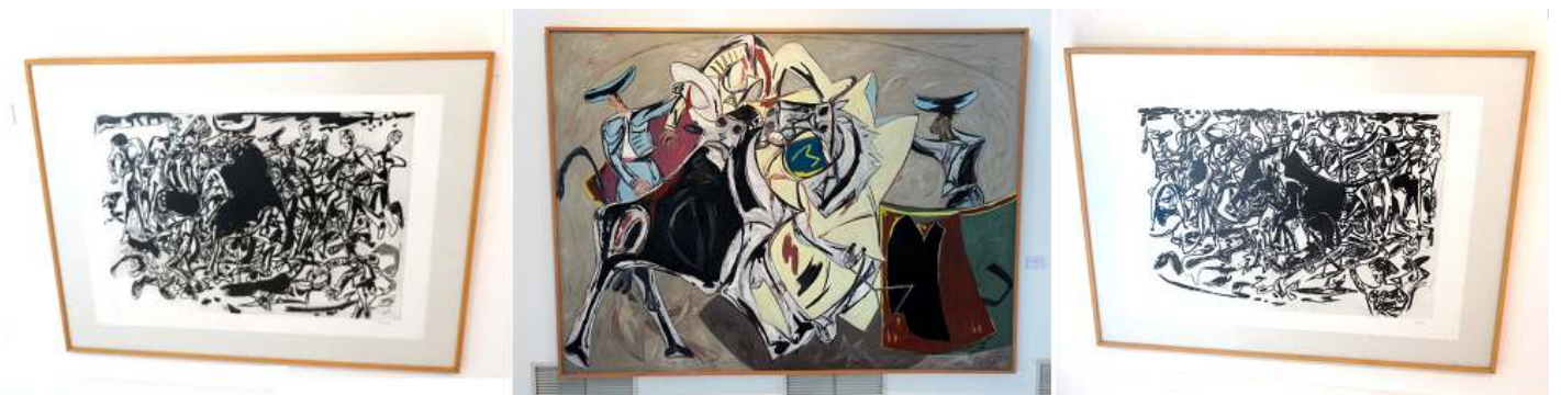
1 Tauromaquia. 1993. 2 Tauromaquia. 1990. 3 Tauromaquia. 1993.