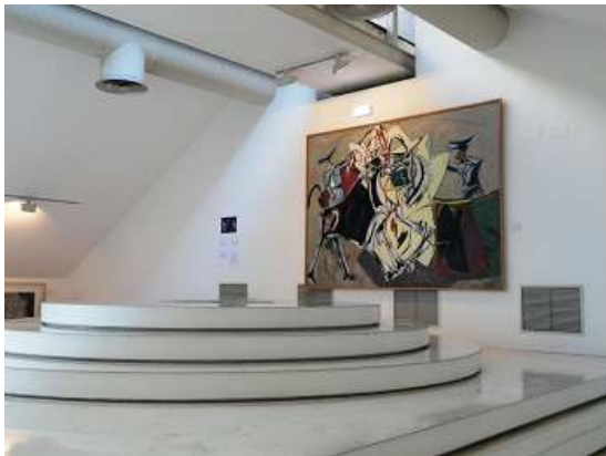
1 Imagen de la última planta