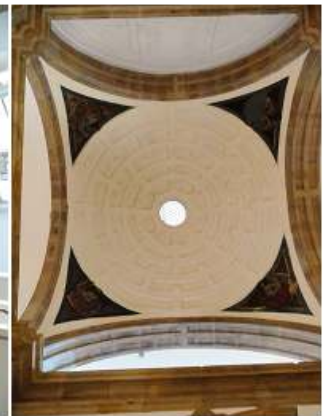
3 Cúpula sobre pechinas de la capilla.

Concluida la muestra de Barjola, descendemos para ver el interior de la capilla que también han dejado un espacio diáfano para exposiciones temporales, aunque en este caso conserva sus muros y decoración.