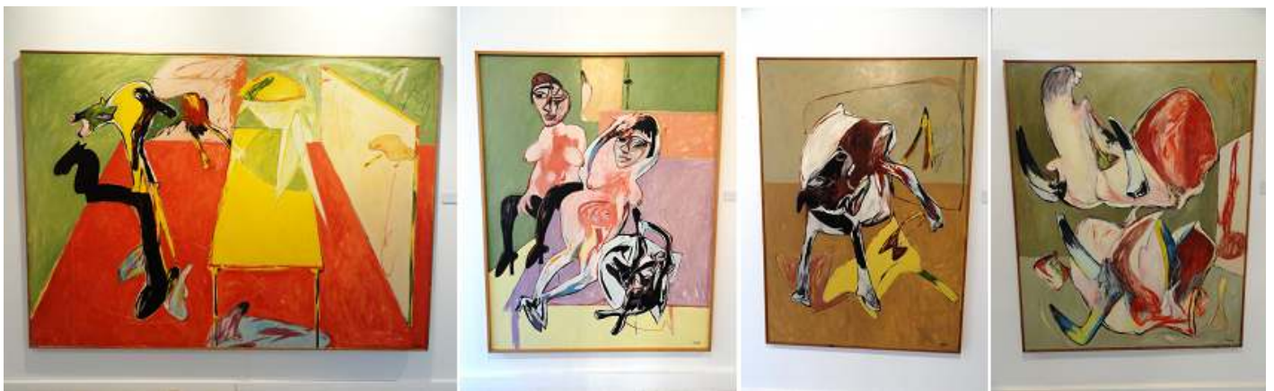
1 Dramático momento. 1984. 2 Desnudo de mujeres con perro. 1987. 3 Perro ciego. 1985. 4 Cráneo de toro. 1986

Su obra abarca desde los años 50 hasta mediados de los 90 que permite ver la evolución del artista.