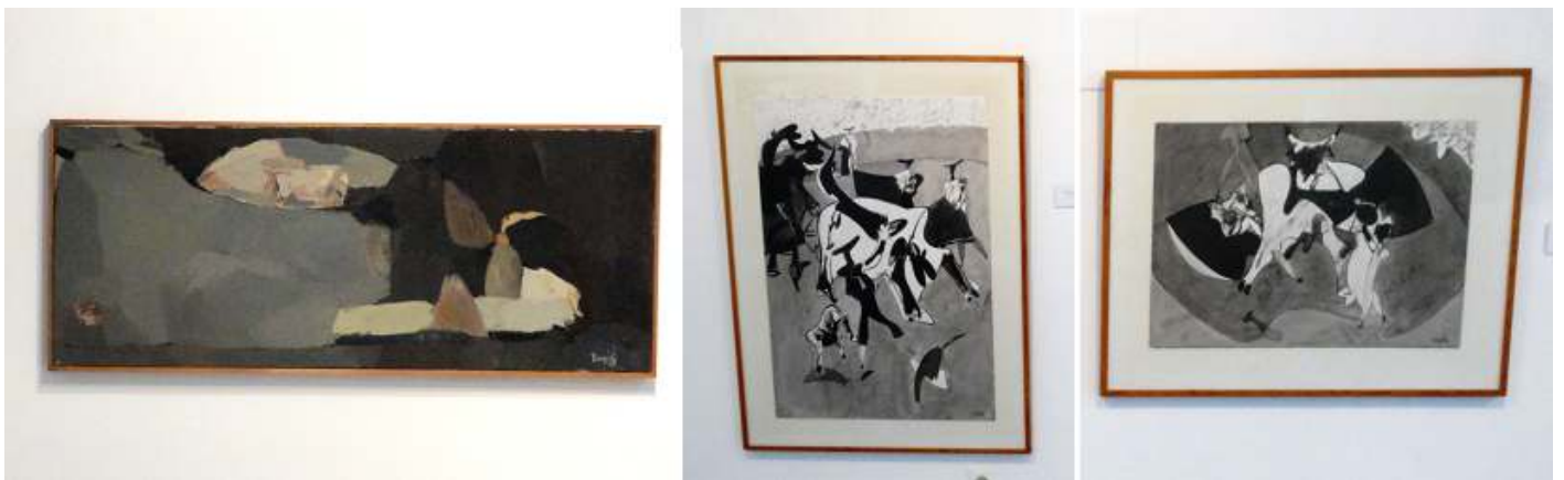
1 Bodegón en grises. 1959. 2 - 3 Tauromaquia. 1980