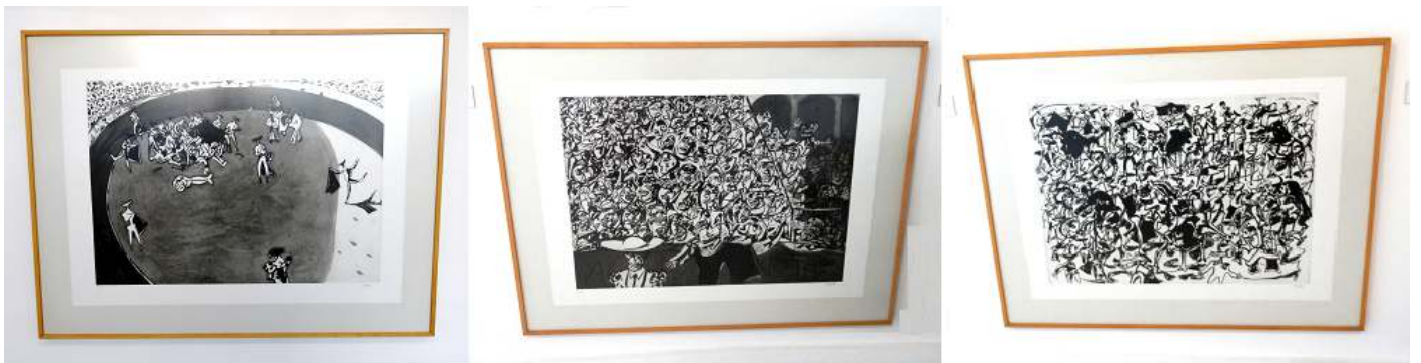
1 Tauromaquia. 1993. 2 Barrera. 1993. 3 Tauromaquia. 1993