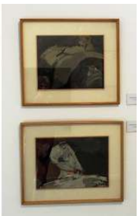
4 Fragmento nº 3. 1962.