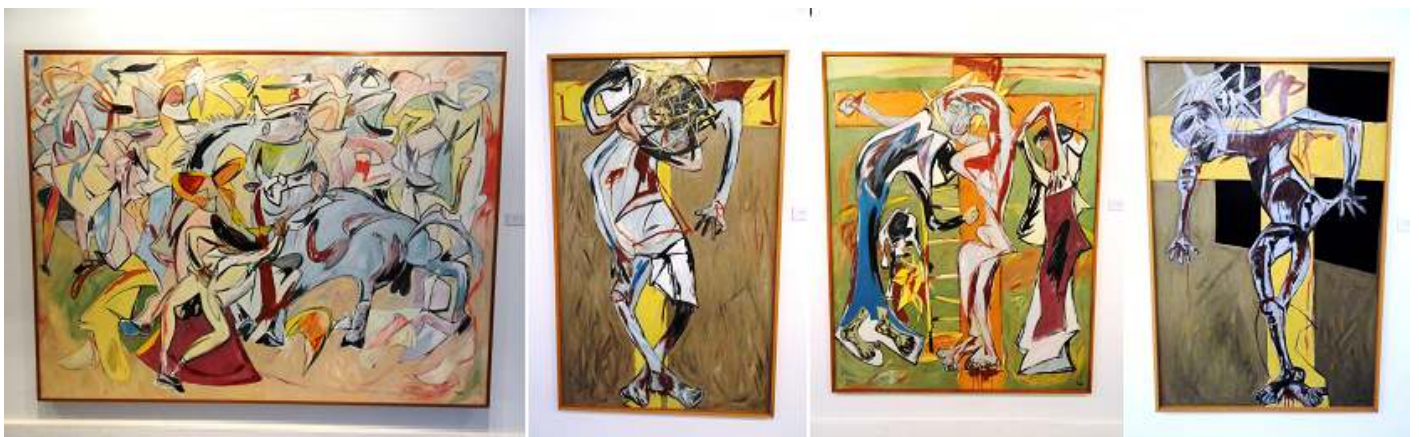
1 Tauromaquia. 1985.

A continuación vemos unas muestras de sus pinturas sobre la Crucifixión y sobre la Tauromaquia y su visión de la fiesta taurina.