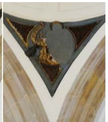
1 San Lucas con el toro. 2 San Mateo con el ángel. 3 San Marcos con el león. 4 San Juan con el águila. 5 Abajo la capilla.