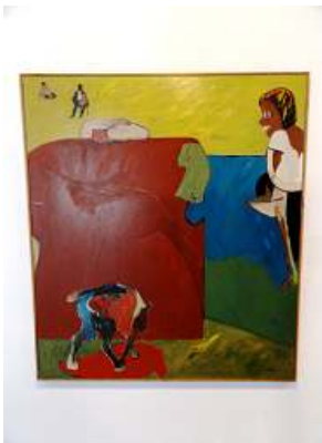
1 Eros en el Campo. 1972.