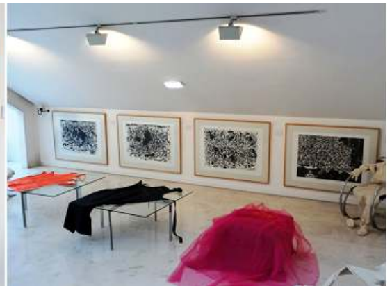
3 Otro grupo de la tauromaquia