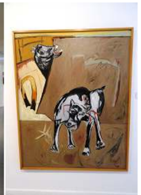
4 Perrera. 1989.