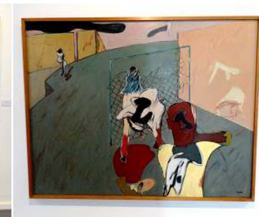
2 Suburbio. 1978.