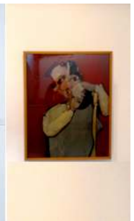
4 Niño de suburbio. 1962