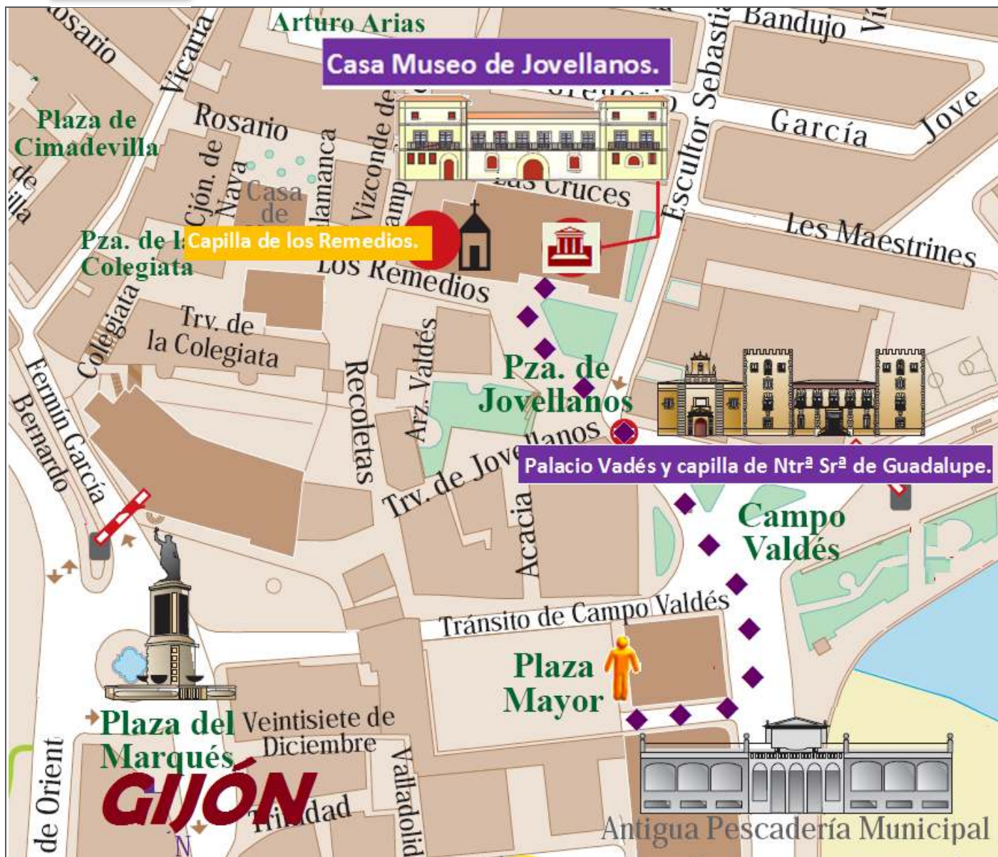
Croquis itinerario visitas, plano empleado de un folleto de Turismo