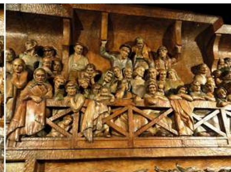
❶ Versión en madera con una escena de los personajes sobre la puerta. ❷ Escena similar a la de escayola con los pescadores. ❸ Otro grupo de espectadores, donde se aprecian los grupos familiares incluso con los niños.