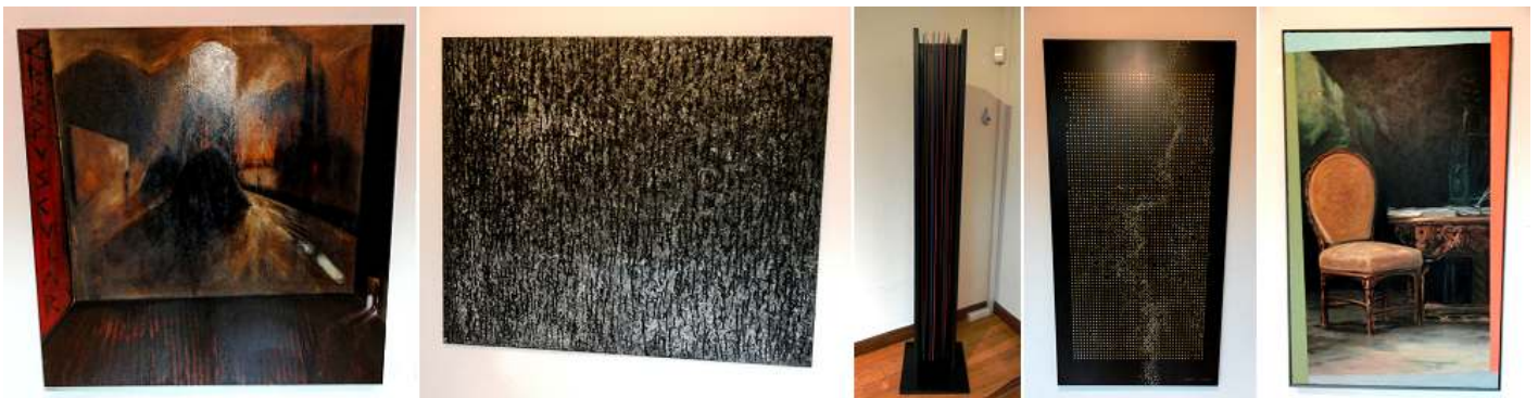
❶ Crepuscular. Pelayo Ortega 1956. ❷ En el Jardín. Ángel Guache 1960. ❸ Columna. Francisco Fresno 1954. ❹ Simiente. Francisco Fresno. 1954 ❺ Jovellanos. Ricardo Monjardín 1956.

Finales del S. XX, nueva figuración y otras tendencias. Generación de pintores asturianos nacidos en la década de los años 50.