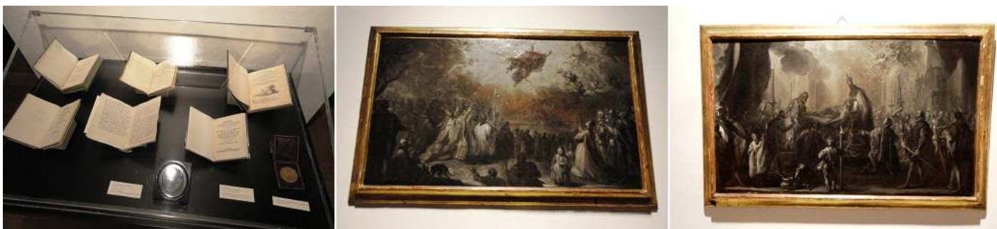
1 Publicaciones de Jovellanos. 2 San Agustín conjurando la plaga de langosta. Miguel Jacinto Meléndez 1679-1734. 3 Entierro del Señor de Ordaz. Miguel Jacinto Meléndez 1679-1734.

Su primer destino fue en Sevilla donde fue nombrado juez magistrado de su Audiencia.