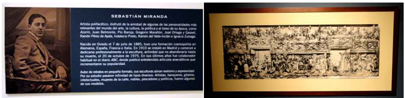
1 Información del artista.

La rula y el retablo, en 1931, Gijón disponía de dos edificios para la venta de pescado, la rula del Muellín dedicada a la pesca de altura y la lonja de Contracay, para los pescadores de bajura. La dos contaban con la misma distribución para la exposición y posterior venta del pescado, y en el piso superior se encontraban los compradores.