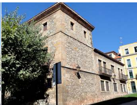
2 Lateral derecho.