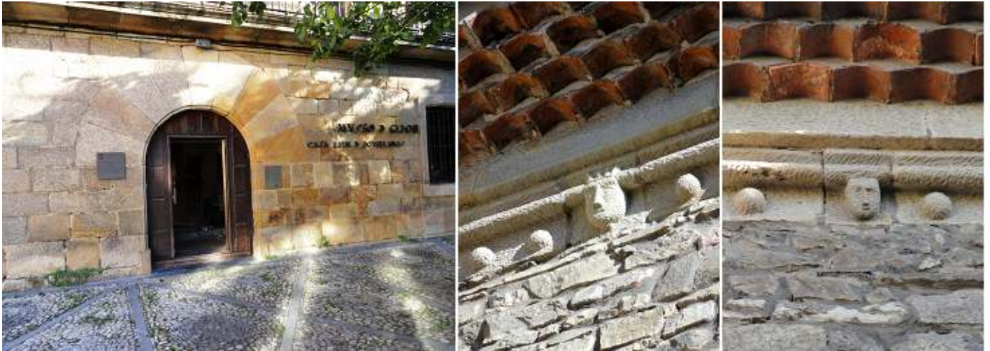
1 Su portada de medio punto con grandes dovelas. 2 . 3 En la parte superior del alero hay una decoración con bolas y caritas humanas.