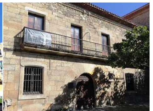
3 Fachada principal con un gran balcón corrido.

En el destacan los fondos de arte asturiano comprendido en los S. XIX y XX, sin faltar las corrientes contemporáneas.