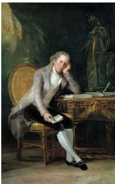
① Melchor Gaspar de Jovellanos, Pintado por Francisco Goya y Lucientes en 1798 en Aranjuez, después de que fuera nombrado Ministro de Gracia y Justicia por Carlos IV.

Agradezco a todas las personas que con su tiempo han colaborado y facilitado la información de los mismos.