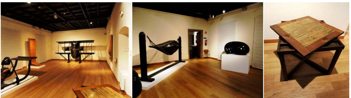
❶ Esculturas de este autor.