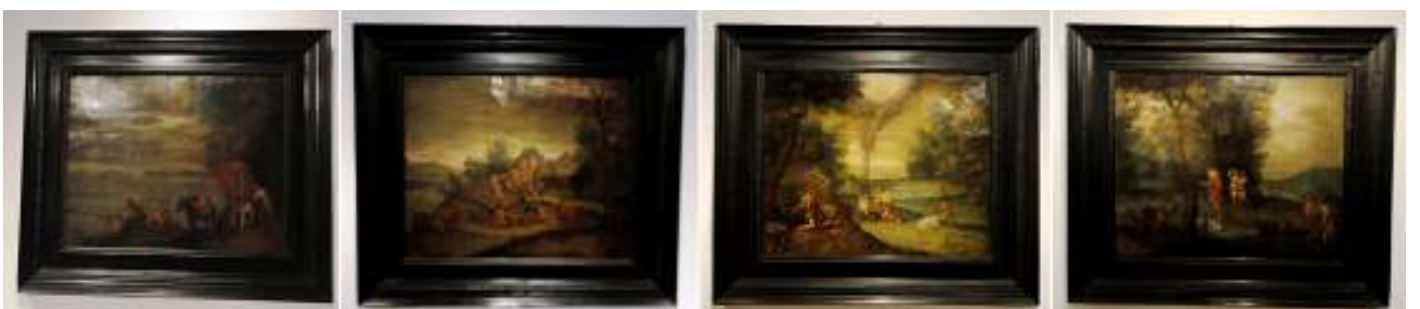
❶ El diluvio universal serie de Jacob Bouttats S. XVII. ❷ La construcción del arca de Noé. ❸ Las ofrendas de Caín y Abel. ❹ La instalación de Adán y Eva en el paraíso.