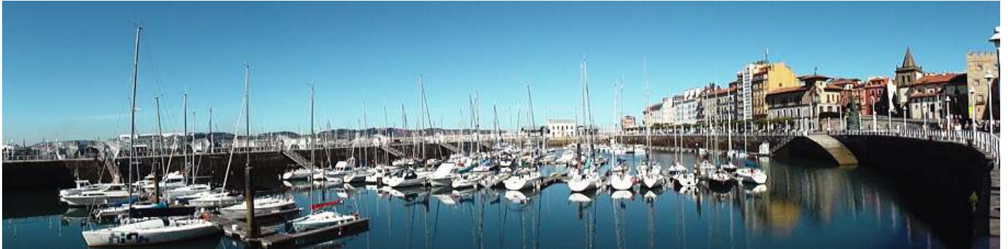
1 Panorámica del puerto junto la Plaza del Marqués.

Dentro de las visitas que nos ofrece esta ciudad, una de ellas es la Casa Museo del Insigne Melchor Gaspar de Jovellanos, donde se pueden apreciar parte de sus aposentos.