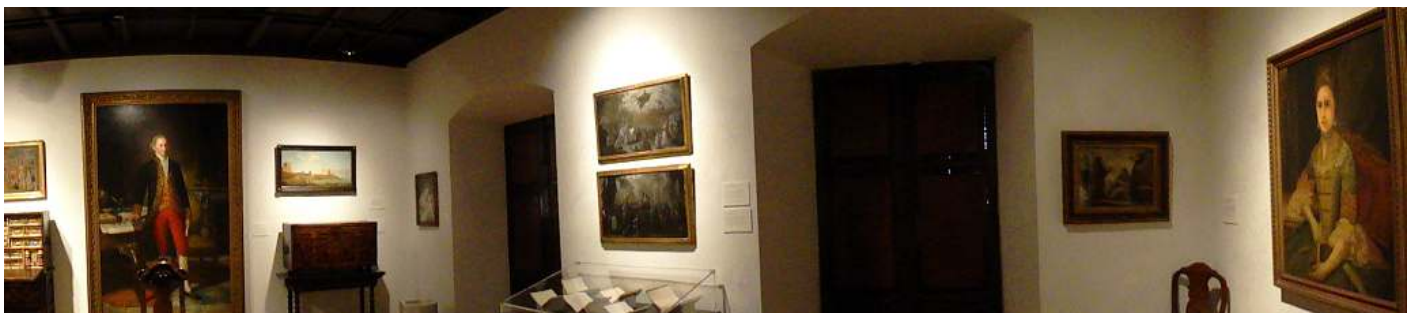
1 Panorámica de esta primera sala.