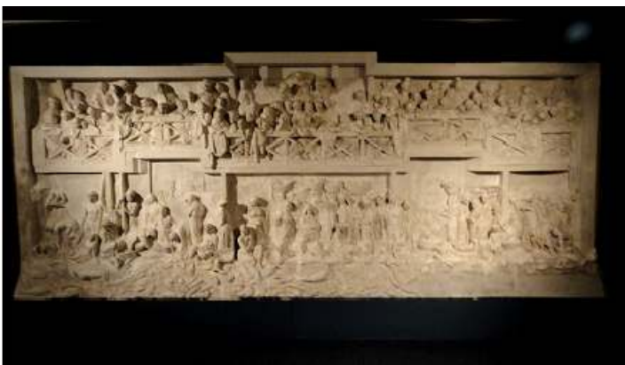
❶ Retablo del Mar, 1972 madera de pino policromada (segunda y definitiva versión de madera). ❷ Retablo del Mar 1972, escayola. (de esta versión se realizó el anterior de madera)