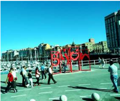
1 Instantánea junto al puerto.