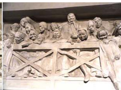
❶ Personajes con el pescado en la versión de escayola. ❷ - ❸ Dos grupos de personajes contemplando la subasta en el primer piso.