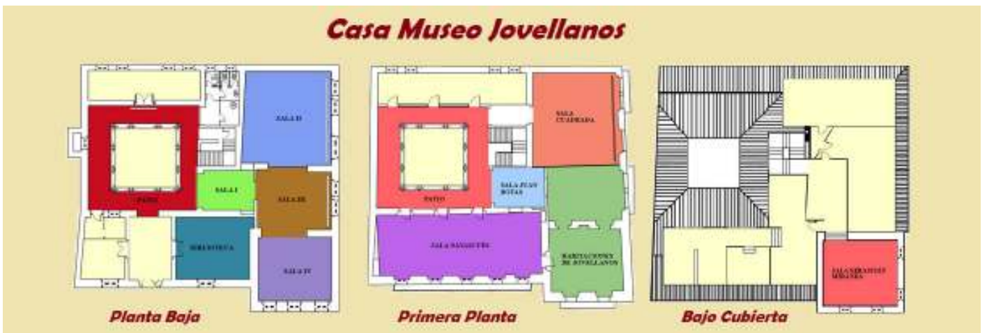
1 Croquis distribución del museo tomado de su web.