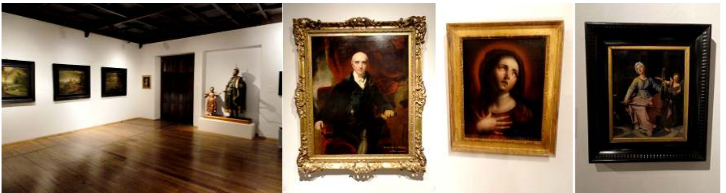
❶ Nueva sala. ❷ Richard Colley, Marqués de Wellesley. Sir Thomas Lawrence 1769-1830. ❸ Virgen suplicante. Anónimo, escuela Boloñesa S. XVII. ❹ Santa Cecilia. Angelo Caroselli 1585-1652.

Tras unos meses en el ministerio fue cesado en 1798 y regreso enfermo a Gijón.