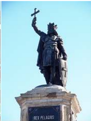
2 Monumento al rey Pelayo.