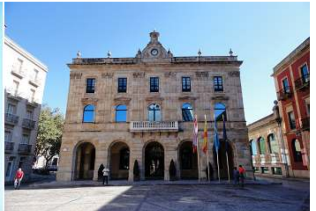
3 Plaza Mayor con la casa Consistorial.

Situándonos en la plaza Mayor, a escasos metros andando tenemos el museo.