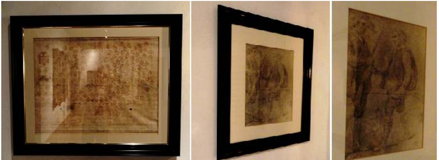
1 Árbol genealógico y blasón de la casa de Jove Llanos 1780. 2 Cazadores con escopetas. Francisco de Goya y Lucientes 146-1828. 3 Ídem.

En marzo de 1801 por una delación anónima fue detenido y como reo sin juicio fue confinado en la isla de Mallorca