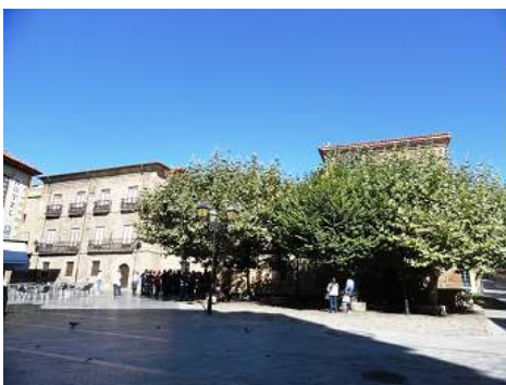
1 Pazulela de Jovellanos con la casa palacio tras los árboles.

Casa Natal de Jovellanos construida entre finales del S. XIV y principios del XVI.