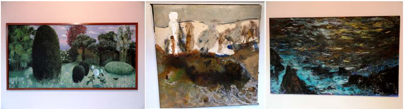
❶ Mayo, tarde plateada Reyes Díaz 1948. ❷ El Muro. Mariano Matarranz 1952. ❸ Marina. Melquíades Álvarez 1956.

Finales del S. XX, nueva figuración y otras tendencias. Generación de pintores asturianos nacidos en la década de los años 50.