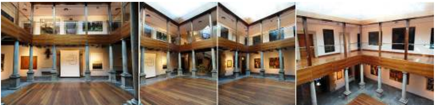
1 - 2 - 3 - 4 Varias tomas del patio del museo